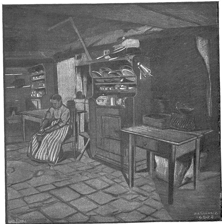
Haus Eatterbach im Simmental. Kücheninterieur. Nach farbiger Kohlenzeichnung von W. A. von May, Bern-Berlin.

Christen ließ sich des Pfarrers Botschaft nicht zwei Mal sagen! Am selben Abend noch, kaum heim von