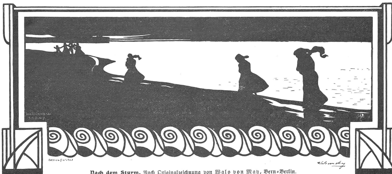
Nach dem Sturm. Nach Originalzeichnung von Walo von Nay, Bern-Berlin.