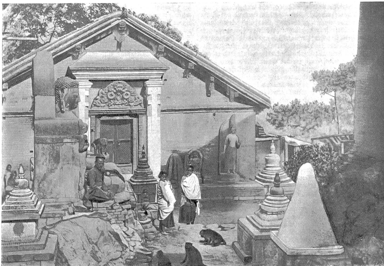
Auf dem „Gipfel der Toleranz“ Abb. 5. Der Affe auf dem Buddha-Standbild.

Backofen in die Oeffnung hineinschob, aus der das frühere Affenbaby ohne Säumen alles wieder herausopfert, was der biedere Nepaler kurz zuvor vertrauensvoll in die Nische hineingeopfert. Es sah einem spiritistischen Wunder gleich, wie die Rüsse aus der dunkeln Luke hervorgesaust kamen. Statt auf die Mittagstafel der Mönche gerieten so all die guten, Gott geopfert Gaben in die Klauen und Kehlen der diebischen hochheiligen Bande, die nach vollbrachter Tat den hoffnungsvollen Sprößling aus der Blicke des Schutznetzes am Schwänzlein herauszog, rasch die Bäckentaschen bis zum Plätzen vollpackte und sich dann seitwärts in die Baumwollbüsche schlug.