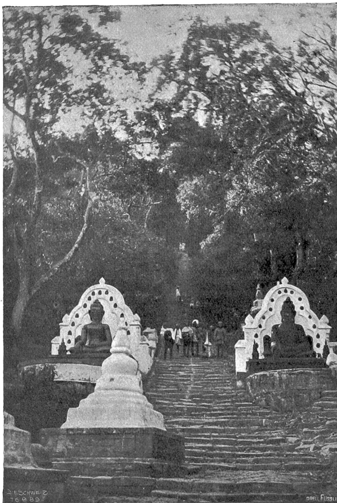
Auf dem „Gipfel der Toleranz“ Abb. 1. Ausgang zum Swayambunathberg.

Freilich ist es eine ziemlich beträchtliche Strapaze, die steile Felsstreppe zu diesem Gipfel emporzuklimmen, der, mit hohen Mauern umgürtet, keinen Einblick von benachbarten Höhen gestattet. Wohl oder übel müssen wir die einer Jakobsleiter gleich scheinbar zum Himmel