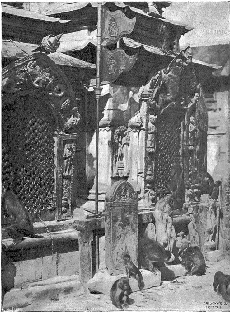
Auf dem „Gipfel der Toleranz“ Abb. 4. Die bleibischen Affen an den Nischen.

Bei dieser so wenig auf die unter Gebildeten üblichen Formen Rücksicht nehmenden Behandlung drohte selbst meine unendlich elastische Langmut jählings in die Brüche zu gehen. Erboßt spazierte ich in ein noch entlegeneres Eckchen, um wenigstens ein Butterbrötchen in Ruhe zu genießen. Als mir aber selbst hier der Schinken vom Brot herunterrutschte und vor meinen sichtlichen Augen in der Luft herumtanzte, griff ich wütend zu meinem Schirm, um dem triefäugigen Räbelsführer der Räuber das Fell zu verpöhlen. Der aber sprang mit tückischem Blick hastig zur Seite, packte dabei unversehens mein zierlich geflochtenes Frühstückskörbchen mit den Zähnen und schwang sich damit in den Wipfel eines Rhododendronbaumes, wo er sich gelassen niederließ, den Korb mit den Beinen umarmte, wählerisch in meinen ekbaren Schätzen herumschnüffelte und mir zwischendurch eine Büchse Sardinen und eine andere voll Anchovispastete an den Kopf feuerte, die er nicht gleich aufknacken konnte. Als ich dann, kühn wie Don Quixote, mit meinem Regenschirm gegen seine Kumpane vordrang, griffen diese zu herumliegenden dürren Nestern, um meine Lusthiebe durch noch schneidigere zu überbieten. So standen wir uns gleich den drei wütend gewordenen „gerechten Kammern“ Gottfried Kellers gegenüber.