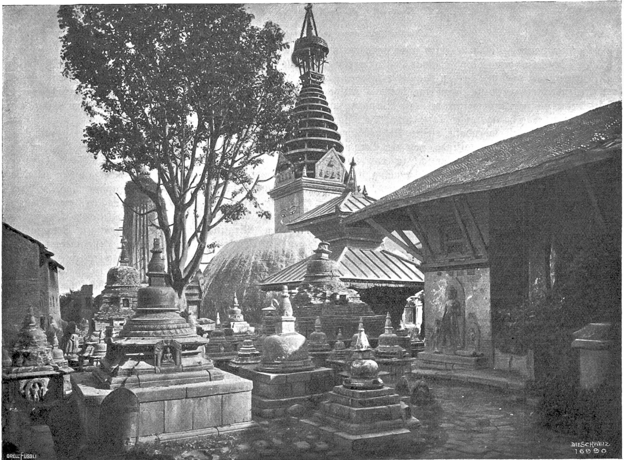
Auf dem „Gipfel der Toleranz“ Abb 2. Auf dem Gipfel des Swahambunathberges.

hinaufführende, oben sich in der Baumumgebung verlierende Stiege hinaufzuklettern versuchen (s. Abb. 1).