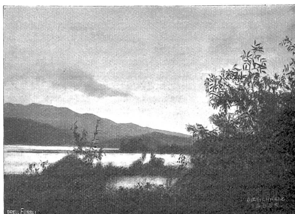
Blick von der Lüzgelau nach der Ufenau (Phot. J. J. Sonegger, Zürich).

An einem der ersten schönen Dezembertage des vergangenen Jahres ließ ich mich wieder einmal hinüberrudern zur Lüzgelau, und als ich auf dem Boden des künftigen Amphitheatere stand, mir den Abschluß der weinumrankten Pergola vorstellend, und lange, lange den Anblick des herrlichen Rundbildes der Gegend genoß, vom leise bewegten Schilf über die duftigen Wasser hinweg zum Hochgebirge hin, als Säntis, Speer, Schäniserberg, Teile des Mürtschenstocks und die Schroffen des Wäggitales und die dunklern Vorberge des Schwyzerlandes so greifbar nahe schienen, im Mittagssonnenschein so freundlich herübergrüßten und die nachbarliche Ufenau ihre landschaftlichen Reize wirken ließ, da wurde mein Sinnen weit, die Brust hob sich, und ich gelobte mir unter dem Eindruck dieser zaubergewaltigen Natur, in meinem Verufe dazustehen als ein treuer Wächter der unermesslich reichen Schätze, welche die Großen und Größten unserer Dichter geschaffen, gelobte, auf diesem Boden „Inselkunst“ zu pflegen, gesichert vor dem oft schlammhaltigen Strome des Tages. Vor meinem innern Auge erschienen sie, die Großen im Reiche der Dichtkunst: ein Klopstock, Goethe, Conrad Ferdinand Meyer, sie haben längst die Gegend geweiht und hier Beziehungen zwischen Kunst und Natur gewoben.