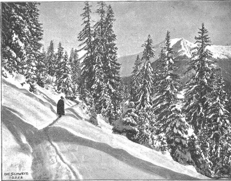
Winter im Gebirge.

scher Wind jagte die dicken hängenden Wolken am Himmel nutzlos umher —