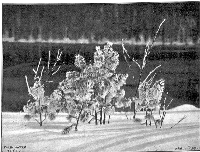
Reifstudie (Phot. Willi Schneider, Davos).

Sie blickte hinaus durch das hohe Fenster in die rabenschwarze Nacht: kein Laut, kein Licht ringsum! Ein stürmi-