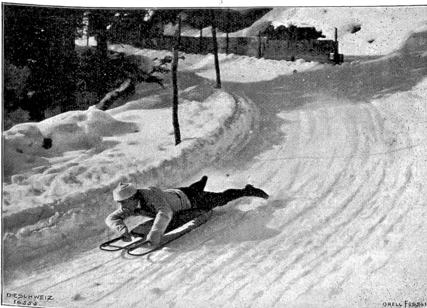
Vom Bobsleigh-Rennen auf der neuen Schlittbahn Schatzalp-Davos. Das besonders von Engländern geliebte Bächlingsfahren (Phot. Willy Schneider, Davos).

Vor einigen Jahren stand am Fikroy Square ein kleines, schmales und sehr baufälliges Haus mit schmutzigen, geschwärzten Verzierungen in Stuckarbeit. In der Breite hatte es nur zwei Fenster, war aber dafür drei Stock hoch wie so manche der kleinen Londoner Häuser. Das ganze Quartier ist dann niedergelassen und durch einige hübsche, aber sehr prosaische Backsteinbauten ersetzt worden. Zu dem in nächster Nähe gelegenen schmucken und belebten Vorland-Platz bildete Fikroy Square eine schäbige, ärmliche Nachbarschaft; nur die prächtigen Bäume, die während der schönen Jahreszeit sächelnd und rauschend angenehme Kühlung und Schatten spendeten, gaben dem Ort ein freundliches Gepräge und verloren selbst im Winter, wenn sie kahl und schwarz sich vom grauen Nebel abhoben, nicht an Reiz.