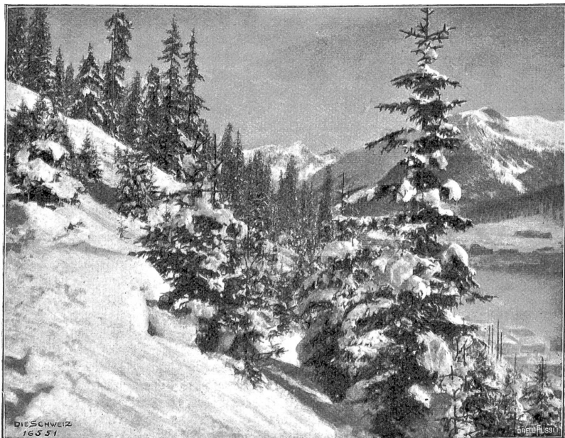
Winter im Gebirge (Phot. Willy Schnelzer, Davos).

Was der Schweizer anfaßt, das packt er mit großen Händen. Diese Art schafft uns das Schweizerische Idiotikon, um das uns das Ausland beneidet, die märchenreiche Sammlung unserer Sprache, eine ungeheure Aufgabe für den Fleiß und die Liebe der Schatzmeister, die viel mehr gewürdigt werden sollte und von Rechts wegen zur Hausbibliothek unserer Bürger gehörte. Ist sie doch allmählich in mäßig angelegten Lieferungen zu beziehen. Kein Buch ist mehr zu unserem vertrauten Freund und Erzähler gemacht als dies Schatzkästlein unserer Lieder- und Spruchweisheit und all die alten Bräuche be-