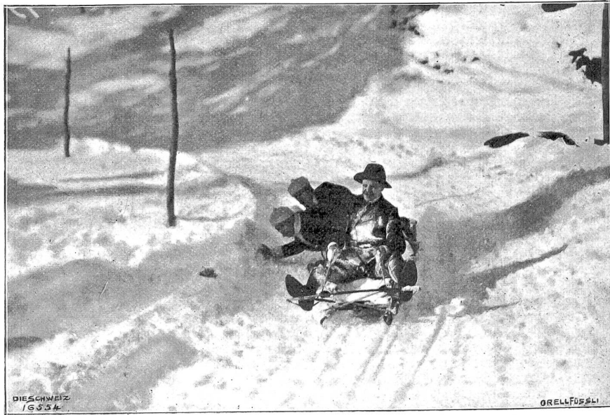
Vom Bobsleigh-Rennen auf der neuen Schlittbahn Schatzalp-Davos. In der Kurve.

charakteristischen Schönheiten unserer Städte und Dörfer längst geliebte und wieder ganz ungreiflich übersehene Bilder und wohl ein jeder bisher unentdeckte beglückende Zeugen der alten Schweizer Baukunst. Das beginnt mit der malerischen Torpartie am Fuße des alten Narau und dem flochten Kollinbrunnen des schmucken alten Zug. Da kommen die antiquarische Perle der welschen Schweiz, Estavayer, dann das wundervolle gotische „Stöckli“ von Kerns und das lauschige breitgehäbige „Winfelriedhaus“ zu Stans, viel stattliche Junfer- und Bürgerhäuser von Bern, die Münchensteiner „Au“ und das Bergünner Gerichtshaus, wie es war, und das Märchen im Grünen am Bielersee, das „Haus des Junkers von Ligerz“. Da sind die burgbekrönten Städtlein von Thun und Lenzburg mit ihren Prachtsgassen, die feine Eleganz des Treppenhauses in der Maison de la Pierre in St. Maurice, Asconas berühmte Casa Borrani. Feine Interieurs aus Genf und Zürich lernen wir kennen und schöne Portale aus Basel. Wir können nicht von ihnen allen erzählen. Neuenburg und Lausanne, Biel, Bostingen, Twann, St. Gallen, Locarno, Glarus, Solothurn, Luzern, Engadin und Prättigau, Müntstertal und Herrschaft, Altdorf, Schwyz, Winterthur, Appenzell und Thurgau steuern die weitere Folge zusammen. Es ist eine Anregung. Vor dem einen, was dasieht, erwacht unser inneres Auge, und zehn