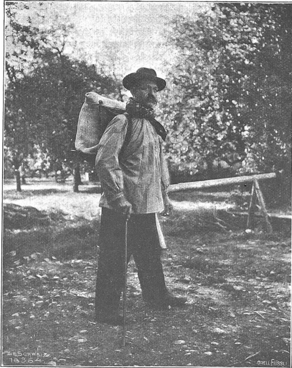
Ammlungfabrikation in Tägerig. Sauterer mit „Mäf“.

händ de ganz Tag chönne de Seuhafe ob ha und drunder füre, daß s' immer e haibe Stai g'ha händ zum Glätte. Zum Stärke händ d' Wiber wifes, fins Ammelemähl g'noh, di andere, d' Wäber, d' Buechbinder, d' Bauelefabrike u. s. w. händ nur 'ruchs kauft. Die, wo z' Tägerig jez no ammelemählid, chönd nur no Ammelemähl liferen i d' Zigarrefabrike z' Bonischwil, z' Bäuel, z' Kinech und z' Mänzike. So guet as aber aisti eufen Ammelemählern ihres Ammelemähl gfi ist, und so begärt ab 's gfi ist, so wais i doch nüüd dervo, das vo Tägerig us ainist Ammelemähl an en Usstellig g'schickt worde seig oder das aine von ene en Uszeichnig oder e Medalie oder en Ehremäldig oder fust es Brämi übercho haigt; aber da wais i, das enen ami nohg'rüest worden ist: