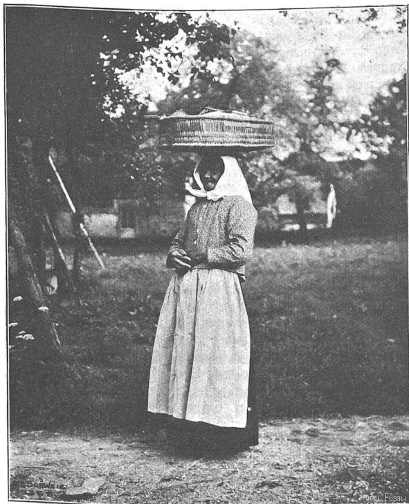
Ammlungfabrikation in Tägerig. Hausiererin.

Ja, sie dachte mehr als die andern an jenen Maientag zurück! Sie verdankte ihm ja so vieles. Erst seit jenem Tage fing sie an zu leben, seit der erste tiefe Schmerz sie durchschüttert. Nicht das große Glück, an das sie so lange geglaubt und das sie von diesem Tage erwartet hatte, war zu ihr gekommen. Aber seine Stiefschwester hatte es ihr gesandt, die leidenschaftslose Selbstgenügsamkeit, die Seelenruhe, die nur der kennt, der vom Leben nichts mehr erhofft. Und sie wollte, wie die andern, eine Erinnerung an jenen Abend auf dem Genfersee besitzen, und da es niemand gab, der ihr feurige Liebesgedichte und bunte Couleurbändchen schenkte, wie ihre Freundinnen sie besaßen, kaufte sie aus ihrem Taschengeld ein kleines Wandbild, das sie gleichsam als Symbol in ihrem Stübchen aufhängte. Es war ein guter Farbendruck von Balestrieris