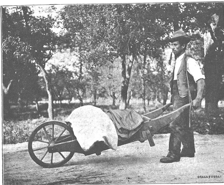
Ammlungfabrikation in Tägerig. Hausierer mit „Stoßbähre“.