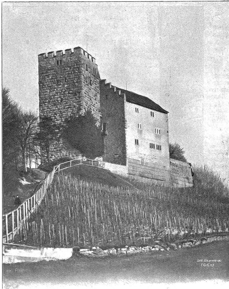
Die Habsburg, von Südwesten gesehen.

Plötzlich blieb er bei ihrem Stuhle stehen und sagte in zweifelungsvollem Tone: „Sie haben mich nie geliebt, wie Sie den andern nie geliebt haben! Es ist bei Ihnen nur die Frage, mit welchem von uns beiden Sie sich bei einer Heirat stolzer fühlen würden!“