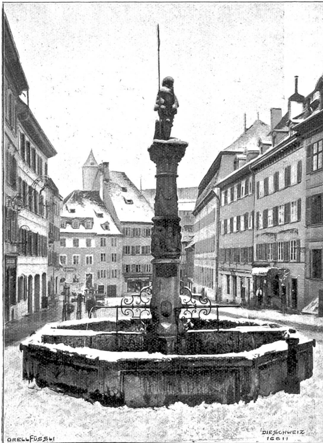
„Le Suisse“, alter Brunnen in Pruntrut.