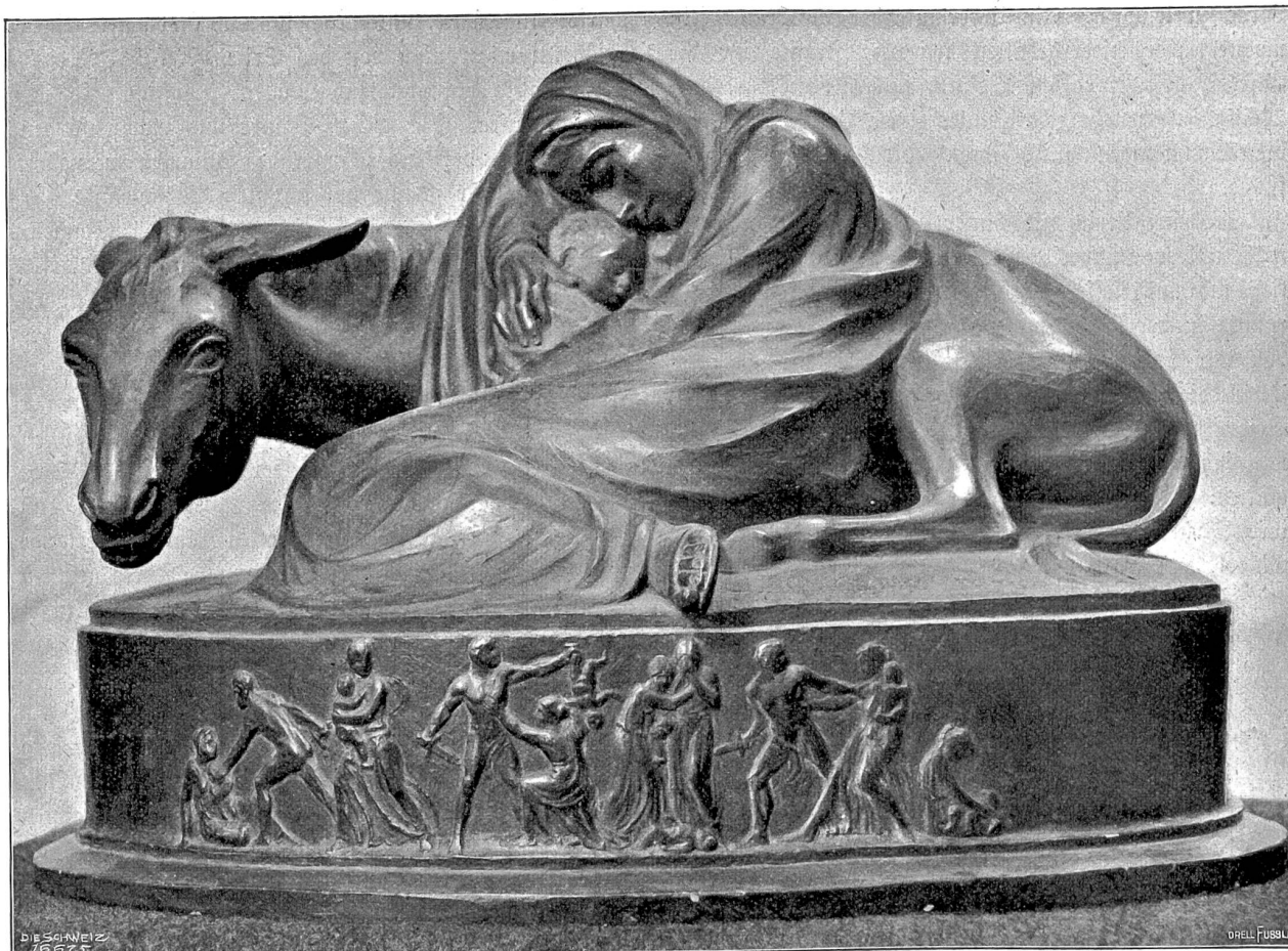
Ruhe auf der Flucht nach Ägypten. Bronze (1900) von Eduard Zimmermann, Stans-München.