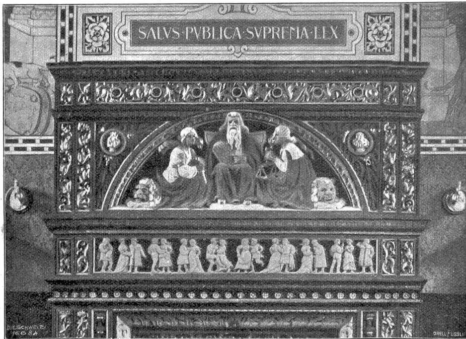
Eduard Zimmermann, Stanz-München. Moses mit symbolischen Frauengestalten (Befehlsgebung und Beiechtigkeit), Relief (1904) im Großratsaal des Basler Rathauses, vgl. „Die Schweiz“ IX 1905, 544.

Ein Tag reihte sich gleichförmig an den andern und eine bange, schlaflose Nacht an die andere. Wenn dann der Morgen die ersten zarten roten Wölkchen über den Berggipfel drüben emporhob und vollends wenn die Sonne hervortrat und ihre gleißenden Strahlen die ruhende Stadt unten aus dem Schlummer weckten, dann schwoll die Hoffnung wieder übermächtig in der jungen Frau. Sie würde gesunden, wenn man auch all die andern im Saal, die jetzt noch ruhig schliefen, hinaustragen müßte, sie würde ihrer Familie zurückgegeben! Und steil aufgerichtet, ohne Stütze saß sie und blickte unverwandt in den werdenden Tag hinaus. Und als der Arzt die Morgenrunde machte und zu ihr hintrat, saß sie noch immer so aufrecht, lebhaften Auges und schien ganz den