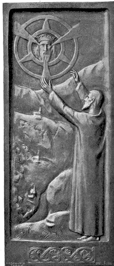
Eduard Zimmermann, Stans-München. Aus dem Leben Niklaus' von der Flie. Wilson (am Himmel erscheint das Symbol der Dreieinigkeits). Bronzerelief (1905) in der Bleibfrauenkirche zu Zürich.

Es froh sie, und sie schloß ihre Augen wie vor etwas Unfassbarem. Der Künstler bemerkte es mitten im Plaudern, hielt es für einen Schwächeanfall und verließ seine Frau, damit sie sich rasch erholen möchte. Kaum allein, erschrak die Kranke vor sich selber. Zum ersten Male in all den Jahren ihrer Ehe war ein Groll gegen ihren Mann in ihr aufgestiegen. Was hatte sie aus den harmlosen Worten herausgehört? Die Fieber müssen ihr die Sinne erregt und den bösen Gedanken eingeküsst haben! War nicht in ihrem Herzen sein Bild dadurch besetzt worden, das bis dahin rein und glänzend dort geherrscht hatte? Gewiß haben ihn zwingende Gründe zu dem Aufenthalt unterwegs bestimmt! Ja, sie