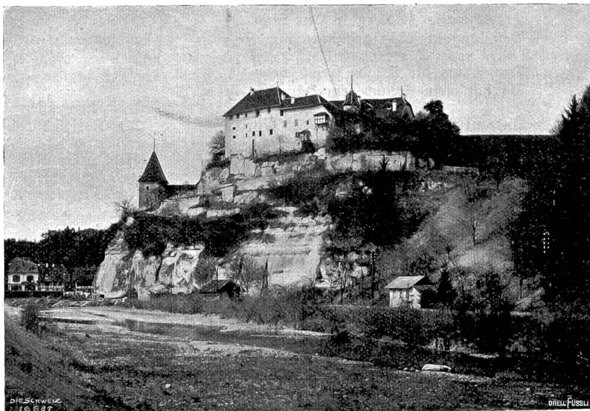
Schloß Laupen, von der Südseite; im Vordergrund die Sense.

Heer schon zu ihrem Empfange gerüstet. Der Feldhauptmann der Berner, Rudolf von Erlach, wollte mit seinen ermüdeten Leuten an diesem Tage nicht mehr angreifen, und schickte sich an, im Angesichte des Feindes sein Lager aufzuschlagen; aber die übermütige burgundische Ritterschaft konnte es nicht unterlassen, die Berner zu verspotten und zu necken, sodaß aus dem allmählich entstandenen Geplänkel gegen Abend sich die grimme Schlacht entwickelte. Die gereizten Berner drangen mit Wucht auf das feindliche Fußvolk ein und überrannten es nach kurzer Gegenwehr; schlimmeren Stand hatten die Hilfstruppen aus der Urchweiz, die sich den Ehrenplatz gegen die Ritterschaft ausgeben hatten. Mit ihren kurzen Hellebarden und Morgen-