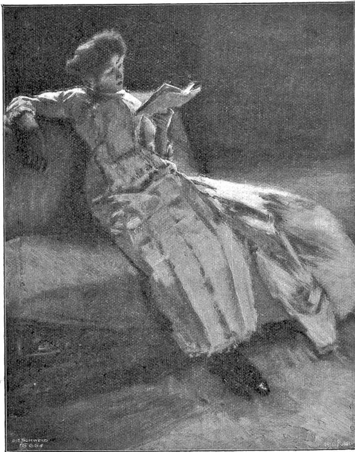
Albert von Keller, München. Lesendes Mädchen (1895).

Auch Keller ist im heutigen Sinne modern und war es längst, ehe der Feinkolorismus sich dank seiner Pariser Herkunft in Deutschland eingebürgert hatte; doch