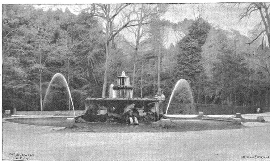
Villa Borghese. Brunnen mit den vier Scepterben, angeblich von Lorenzo Bernini.

Das Haus Borghese war immer modern. Einer dieser edeln Stam-