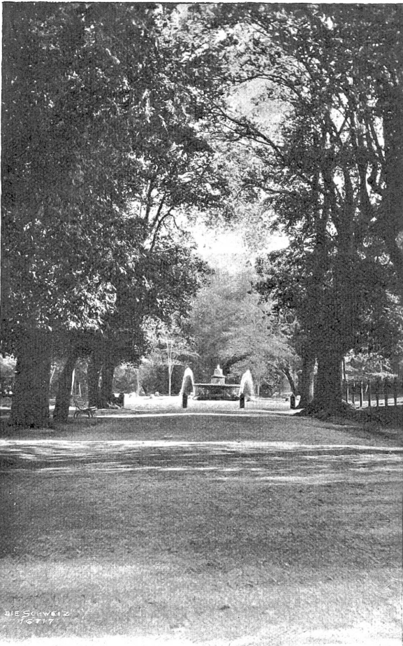
Villa Borghese. Partie aus dem Park.

Carl Spitteler sagen würde, „fatt und dick und angenehm“. Scipio Borghese hieß „das Entzücken Roms“; aus den klugen und lebhaften, aber in ihrer Fröhlichkeit wahrhaft sympathischen Augen seines Bildnisses spricht der ganze Mann zu uns. Es gibt überhaupt keine Marmorarbeit, die einen so unmittelbaren Eindruck der Lebenswahrheit macht. Der Naturalismus Berninis, der in die Bildhauerei fast die Methoden der Van Eyck einführte, hat hier einen Höhepunkt erreicht. Nur die Abstraktion von der Farbe wahrt die stilistische Größe — der packende Eindruck einer unmittelbar wiedergegebenen Existenz ist dennoch stärker als bei den Wachsfiguren höchster und raffiniertester Realistik.