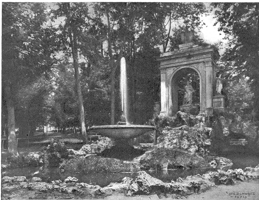
Villa Borghese. Neptunbrunnen.

Borghese waren die beiden Büsten die ersten, die nach einer höhern Gerechtigkeit in dem vornehmen Casino aufgestellt werden mußten. Sie werden eine gute Gesellschaft wiederfinden; von den Werken Berninis sind einige der schönsten hier vereinigt, und jetzt kann höchstens noch St. Peter dem Casino Borghese den Rang streitig machen für die Erkenntnis dieses Meisters. Der Papst des Hauses, Paul V., ist in einer kleinen Büste vertreten, die eine der ersten Kraftproben des noch ganz jungen Bernini war. Aus derselben Zeit stammt auch die reizende Gruppe von Apoll und Daphnis, eine frühe Vorahnung des Kokos und der Porzellanplastik. Daneben steht der David, den Bernini nach seiner eigenen Gestalt modelliert haben soll. Ein anderer Kardinal, der später den apostolischen Sitz bestieg, Maffeo Barberini, hielt ihm während der Arbeit den Spiegel hin. In dieser heroischen Figur, die jeden Muskel im Augenblick der Tat anspannt, ist ein anderes Ideal der Zeit ver-