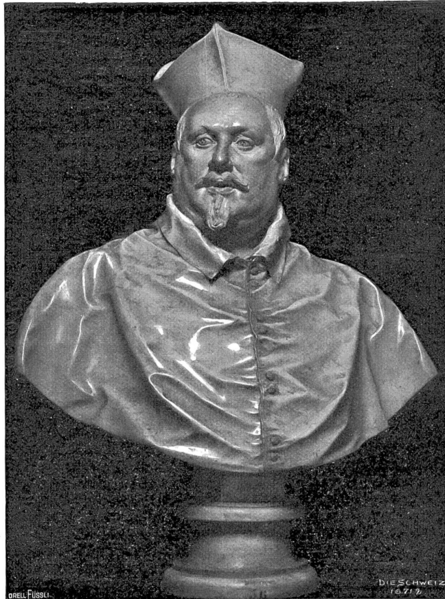
Büste des Kardinals Scipio Borghese von Lorenzo Bernini (1598—1680) in der Gallerie Borghese zu Rom.

Dennoch stehen wir vor dieser ersten Büste mit der unglückseligen schwarzen Ader auf der Stirn mit ganz andern Empfindungen. Hier hören alle akademischen Diskussionen über Stil auf; das Leben selber steht vor uns. Das ist der wahre Grand Seigneur einer prunkvollen und siegesbewußten Zeit, der, an Huldigungen gewöhnt, seine Umgebung mit der wohlwollenden Ueberlegenheit des echten Aristokraten behandelt. Der Kardinal ist etwa fünfzigjährig; bei der Bestimmung des Alters hat sich Baldinucci sicher verrechnet, der das Werk in die früheste Zeit des Künstlers setzt. Die Muskulatur ist durch einen alles weich umfließenden Fettanlag gemildert; der halbhohe Mund verrät die asthmatischen Beschwerden, denen der Kirchenfürst jedenfalls unterworfen war. Denn die hohen Herren dieses Jahrhunderts liebten und verstanden das Wohlleben: man aß und trank gut und ließ sich durch politische Beschwerden nicht den Humor verderben. So wurde man, wie