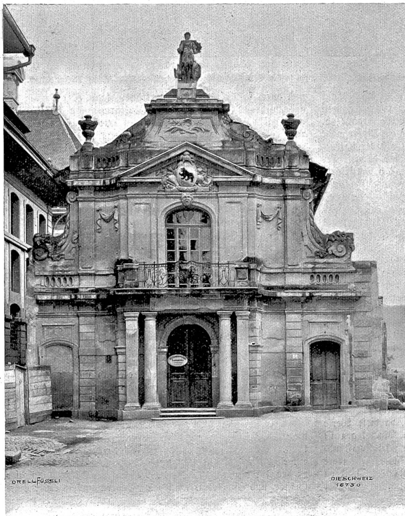
Fassade an der Nordseite des alten historischen Museums in Bern.