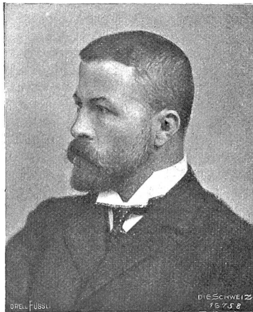
Gottfried Herzig (Phot. C. Ruf, Basel).

Eigentlich bedürften die Bilder des Berner Künstlers hier keiner Einführung mehr, ist doch Gottfried Herzig ein alter Bekannter der „Schweiz“. Im Sommer 1905 haben wir dem Werke des damals noch wenig bekannten Malers eine besondere Nummer gewidmet*), die ein einigermaßen vollständiges Bild von der Art und den Zielen seiner Kunst gab. Es ließen sich damals in seinem Schaffen zwei scheinbar heterogene Linien verfolgen, eine heimatgetreue, bodenständige schlichte Kunst und eine allegorisch symbolisierende, nach großen Gegenständen und erhabenem Ausdruck ringende. Freilich diese Verschiedenheiten lagen eigentlich fast nur im Stofflichen. Die Kunstweise war hier wie dort dieselbe tüchtige, strenge, Wirklichkeitsstreue, allen Phantastereien abholbe. Was wir nun aber seither von Herzigs Werk zu Gesicht bekamen — einiges davon wurde auch durch unsere Zeitschrift vor das Forum der großen Öffentlichkeit gebracht**) — scheint zu zeigen, daß der unablässig strebende, von heiligem Willen erfüllte Künstler