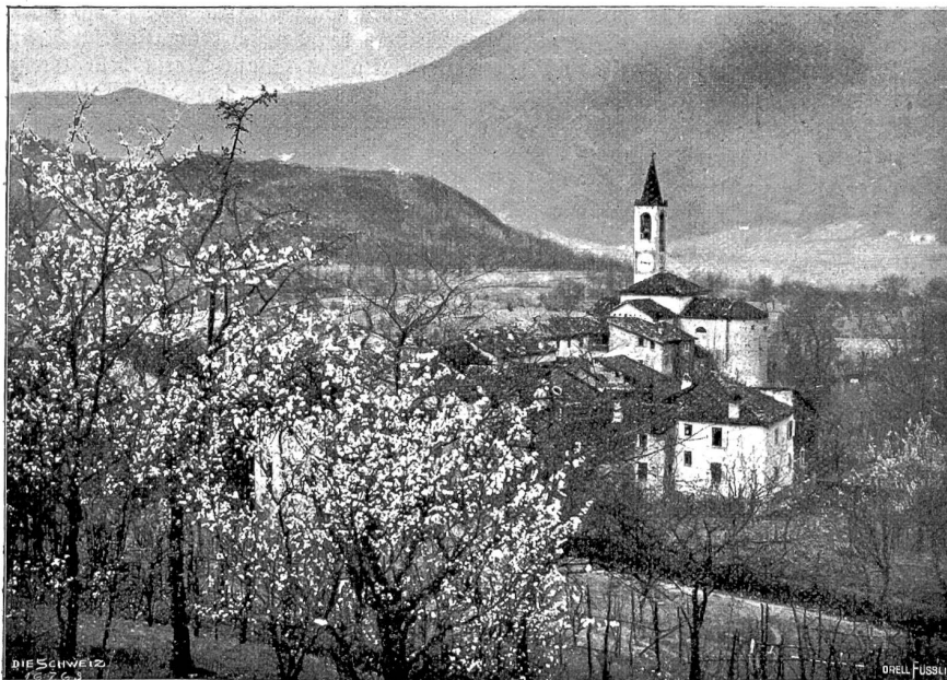
Ponte Capriasca und die Kirche mit dem Heiligen Abendmahl; im Vordergrund blühende Mandelbäume.

Petrucha und Agaschka erreichten ihre Hütte und traten ein... Auf der Bank hinter dem Fenster lag Mitka in seinem verwaschen-roten, baumwollenen Hemdchen, mit einem ernstem, sorgenvollen Ausdruck auf dem eingefallenen Gesichtchen, mit halbgeöffneten Augen. Sein blondes Haar hing wirr um das blassköpfige Gesichtchen. Der Leib war unförmlich gedunsen, unter dem kurzen Hemdchen ragten zwei dürre magere Beinchen hervor, die Händchen waren über der Brust gefaltet... Zahllose Fliegen um-