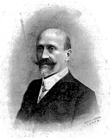
Bundesrat Jos. Schobinger.

Herr Bundesrat Josef Anton Schobinger ist am 30. Januar 1849 zu Luzern geboren. Er widmete sich dem Architektenberuf und war längere Zeit Kantonsbaumeister. Be-