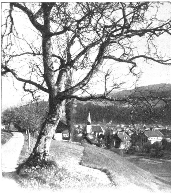
Blick auf Langnau i. E.

Schlatters sind ganz ordentliche Leute. Niemand weiß etwas anderes. Es herrscht dort ein tüchtiger, braver und solider Familiengeist und das richtige Verhältnis der pflichttrauen arbeitstüchtigen Gatten untereinander und zu einer wackern Kinderschar. Auch die nächsten Bekannten erfahren es nicht, daß sich im intimen Verkehr jeweilen gegen den Hochsommer hin eine gewisse nervöse Gereiztheit geltend macht, die offenbar im alten Schlatter ihren Ursprung nimmt und sich dann mehr und mehr über die übrige Familie ausbreitet. Vor dem Frühstück steht Vater Schlatter am Fenster und schaut unentwegt nach dem blauen Himmel über den Dächern, geht dann am Barometer rütteln, mißt mit großen Schritten die Stube in die Länge und Breite und ist wortkarg beim Frühstück. Mutter Schlatter durchschaut den Gatten und findet, daß er überarbeitet sei. Sie ahnt, daß ihn ein großer Entschluß würgt, der vorläufig noch nicht reif ist. Der Gute hatte sich bereits für den Ferienbeginn der Schüler interessiert. Soll sie durch kluge Bemerkungen zur Reife des Entschlusses beitragen? Aber sie weiß