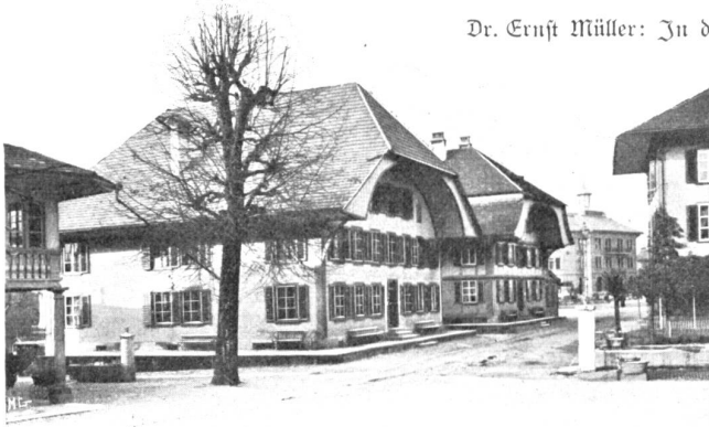
Dorfplatz im Emmental.

aus vieljähriger Erfahrung, daß es gefährlich ist, das langsame Wachstum eines großen Gedankens in der Seele des Gatten zu stören, daß die Berührung solcher Spannung unliebsame Funken entlockt. Aber was will man! Die Spannung teilt sich mit, und Frig, Klasse I Progymnasium, deshalb der Prögeler genannt, plagt heraus mit der ganz direkten Frage: „Papa, wo könnte mer hi i de Ferie?“