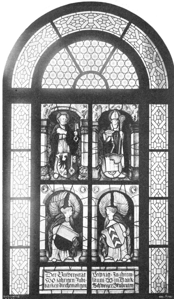
Glasgemälde für die Universität Leipzig (Genf, Freiburg, Lausanne, Neuenburg). Nach Entwürfen von Rudolf Mürger, Bern, ausgeführt von Gebr. Nöttinger, Zürich.

Ritterschaft, den feuerspeienden Drachen. Diesem Bannerträger gegenüber steht ein schmucker Fahnenjunker mit dem Banner der Stadt Bern, eine freie Nachbildung des durch seine Farbenpracht hervorragenden Glasgemäldes aus der Kirche von Lenf im bernischen Historischen Museum. Ein Gefolge von zwei Landsknechten bildet die passende Beigabe. Für Zürich und Basel wurden Wappenscheiben mit den für diese beiden Städte charakteristischen heraldischen Tieren gewählt. Der mächtige Zürcherlein trägt das Schwert, das Papst Julius II. im Jahre 1512 dem damaligen Vororte der Eidgenossenschaft schenkte und das im Original im Landesmuseum noch erhalten ist. Die Baslerischeibe ist eine getreue Kopie derjenigen in dem berühmten Fenster, das die Stadt um das Jahr 1515 in die Kirche von Segenstorf (Kanton Bern) stiftete. — Wäh-