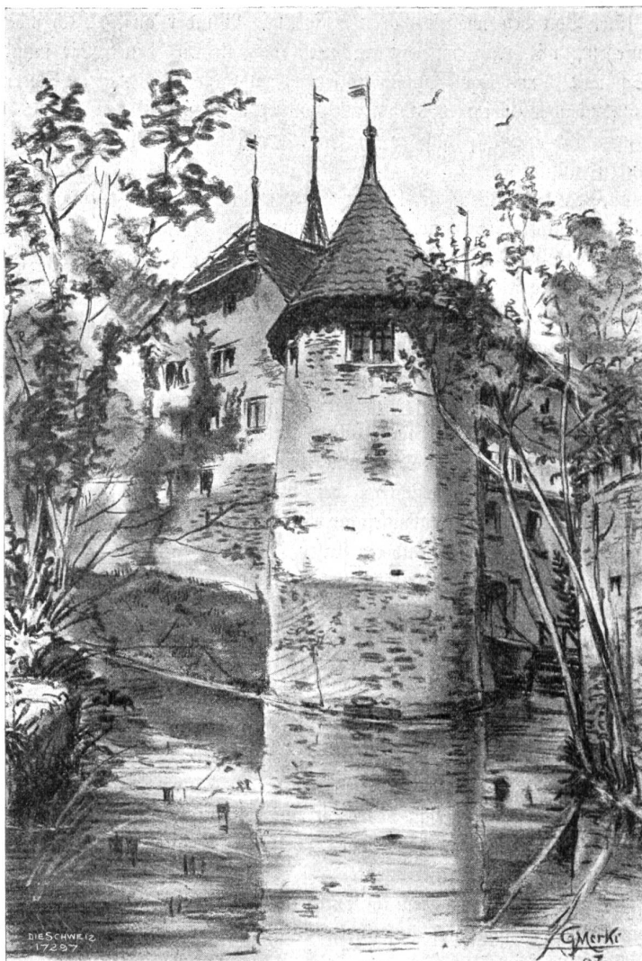
Schloß Hallwyl (von Osten). Nach Kohlenzeichnung von Gottlieb Merki, Männedorf.

Es war eine wundersame Wanderung. Anfänglich schauten sie sich manchmal um. Es tönten Stimmen in ihren Rücken, und sie nahmen an, daß andere Gäste ihnen folgten. Allein die Stimmen verhallten. Nun war nur noch das Knirschen des Kieses, das Geräusch der schwe-