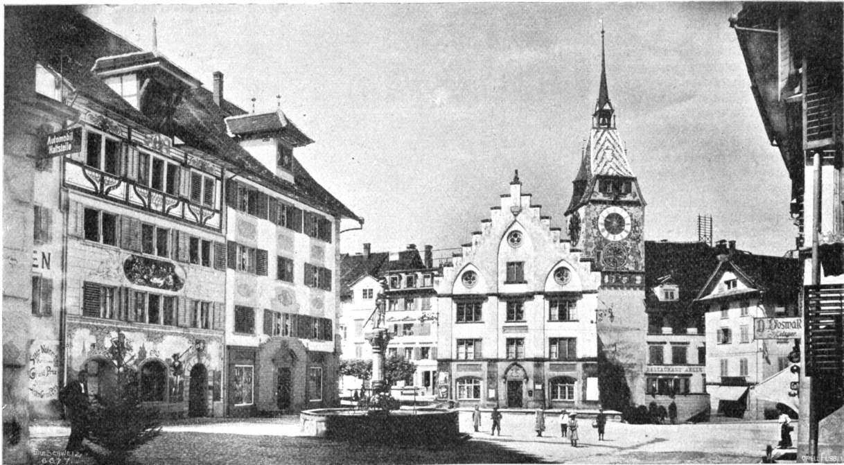
Rolinbrunnen. Stadtkanzlei. Zelturm. Kolinplatz in Zug.