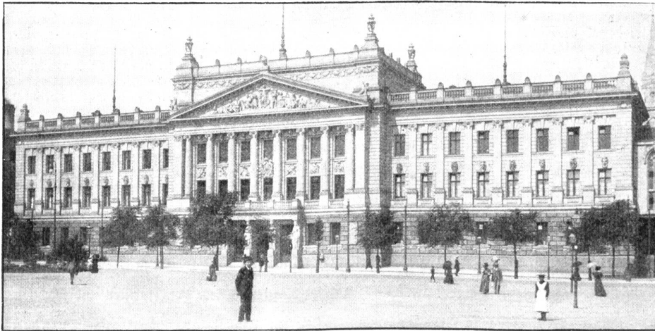
Das Universitätsgebäude zu Leipzig.