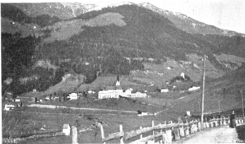
Ansicht von Passaier im Tirol.

O Oesterreicher Kaiser, dir schreib ich es zu, O komm und verschaff dem Tiroler die Ruh, Die boarischen Buben, die französischen Hund, Die richten das ganze Tirolland zu Grund!