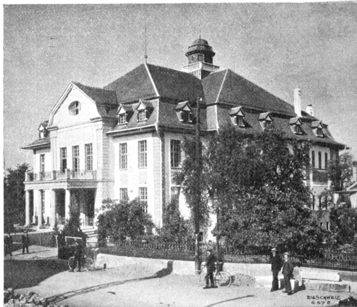
Das neue Theater in Zug.