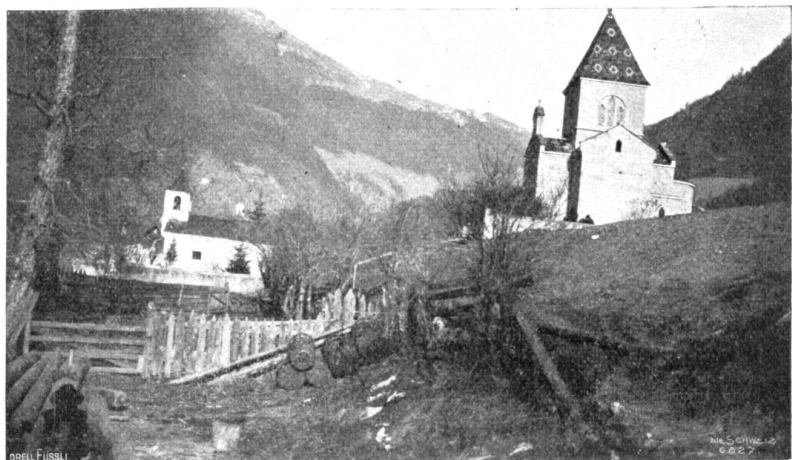
Andreas Hofer-Kapelle in Passaier.

Da kam die unglückliche Schlacht bei Wagram; das aufgeregte Oesterreich mußte bei Napoleon um einen Waffenstillstand nachsuchen, der nur mit dem schweren Opfer zu erkaufen war, daß die österreicherischen Truppen unverzüglich Tirol zu räumen hatten, womit die Tiroler Freiheitskämpfer auf eigene Kraft angewiesen waren. Napoleon rüffete aufs neue eine Strafexpedition aus und beauftragte Lefebvre zum zweiten Mal, „ein Exempel zu statuieren“. „Sie haben die Macht in Händen“, befahl der Korſe; „feien Sie schrecklich und handeln Sie so, daß man einen Teil der Truppen aus dem Lande ziehen kann, ohne befürchten zu müssen, daß die Tiroler wieder anfangen.“ Anfänglich zwar waren diese nochmals vom Glück begünstigt und lieferten den Feinden in der „Sachsenklemme“ eine Schlacht, deren Ausgang für die Franzosen furchtbar war, und wenige Tage später wiederholte sich in der dritten Schlacht am Berg Isel das gleiche grauenhafte Schauspiel. Vollkommen geschlagen mußte Napoleons Heer Innsbruck räumen, und nur durch Verkleidung gelang es dem Marschall, der Gefangenschaft zu entgehen. Andreas Hofer, der nunmehrige Oberkommandant Tirols, wurde nach diesem Sieg von seinen Landsleuten geradezu vergöttert. Bezeichnend für den immer bescheidenen, gottesfürchtigen Mann, der damals in der Hofburg zu Innsbruck residierte, ist die Ansprache, die er hielt, als man ihm seine Ernennung zum Höchstkommmandierenden überbrachte. Vom „goldenen Adler“ aus verdankte er seine Wahl mit folgenden Sätzen: