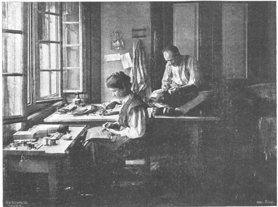
Von der I. Schweiz. Heimarbeitausstellung. Schneider mit Gehülfin in Zürich.

Die Frau wendet das kummervolle Gesicht von dem unheimlich leuchtenden Schneefeld ab, dem Wolkenmantel zu. Ihr ist, als sänte er vom Berg herunter, immer tiefer und tiefer, um auch sie einzuhüllen in seine ernsten, geheimnisvollen Falten.