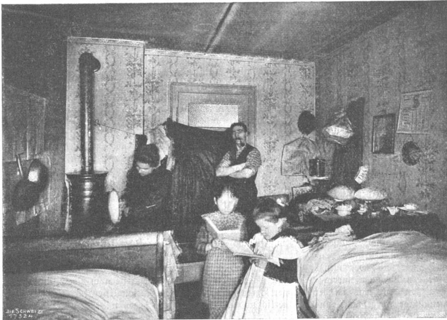
Von der I. Schweiz. Heimarbeitausstellung. Heimarbeiterwohnung in Zürich III. fest polizeilich aufgehoben.

Wald sieht aus, als ob ein Niese darüber hingegangen wäre und mit achtlosem Schritt da und dort eine Lichtung getreten hätte.