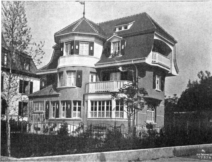
Neue Berner Baukunst. Wohnhaus an der Dachhofstrasse. Architekten: Rigli und Pabel, Bern.

sondere das Recht zur Komposition. Vorläufig freilich wendet sich diese Publikation an den Leser, der in stiller Betrachtung dieses aus Schönheit und Grauen gemischte Gemälde einer vergangenen Kultur mitzuerleben gewillt ist; ihm wünschte ich wenigstens einen Teil dessen fühlbar zu machen, was ich in Stunden dichterischen Nachschaffens selber empfunden habe. Aber letzten Endes soll diese wiederauferstandene Weltanschauungstragödie größten Stils allerdings zu unseiner so sehr auf nivellierende Norm erpichten Zeit sprechen — noch immer ist das Außerordentliche, das Göttliche nicht ausgestorben, noch immer sind die Götter da, um verehrt zu werden!