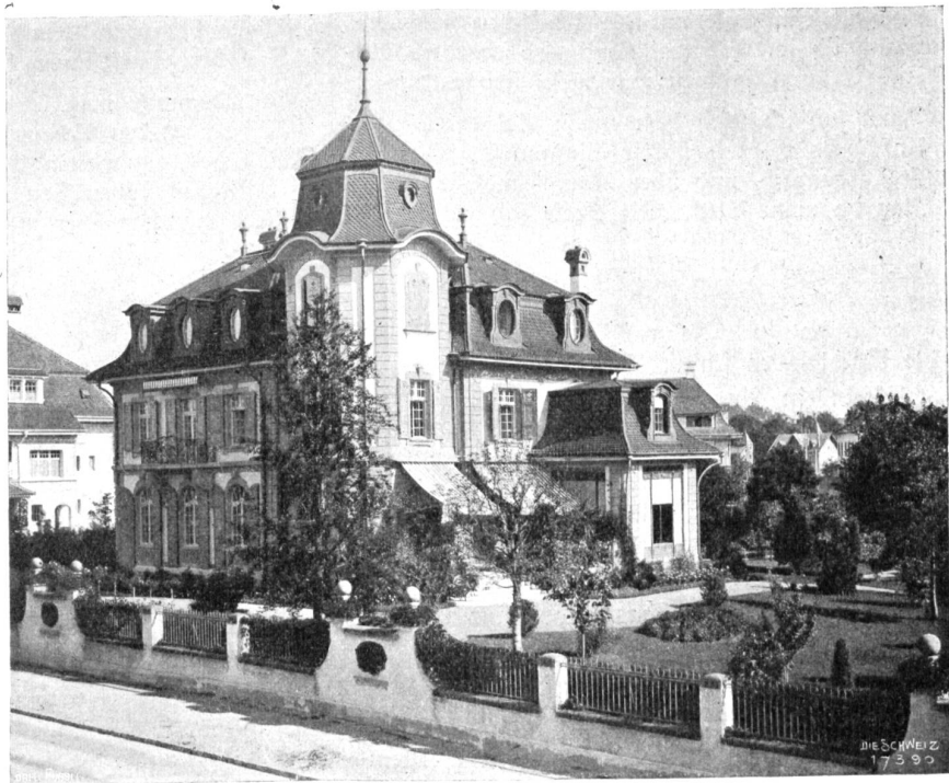
Neue Berner Baukunst. Villa v. Tschärner an der Eisenstraße. Architekt: N. von Wursterberger, Bern.

Ich übergebe mein Werk der Öffentlichkeit in der Hoffnung, der alte große Dichter und eine alte große Zeit möchten — zwar nicht mit ihren Worten, wohl aber mit ihrem Empfinden — zu geneigten Herzen sprechen. Daß ich in meiner Bearbeitung von dem törichten Bemühen, in einer ganz andern Sprache die Rhythmen des Originals nachzuahmen, abgesehen habe, bedarf wohl keiner Entschuldigung: es handelte sich nicht um eine Uebersetzung, sondern um eine völlige Umschmelzung und Neudichtung, die von vornherein auf die Ehre verzichtet, ein gelehrtes Publikum zu befriedigen. Gute Dienste bei dem nicht leichten Unternehmen leistete mir die freie Uebersetzung der Tragödie durch Hans