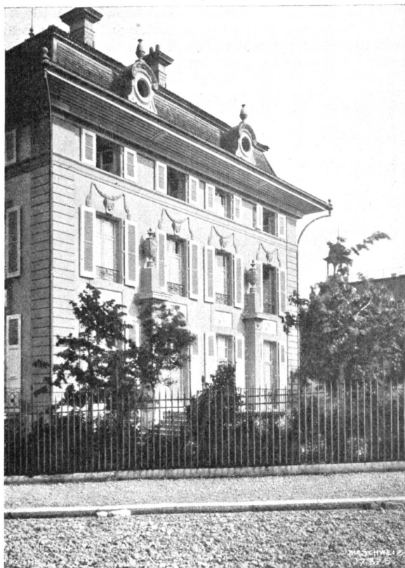
Neue Berner Baukunst. Wohnhaus am Thunplatz. Architekt: S. B. von Fischer, Bern.

Diese Andeutungen mögen genügen; sie sind so wenig verbindlich wie die Bezeichnungen der Ensemblestücke im Text, die auch nur dem Komponisten eine Möglichkeit bieten sollen. Vielleicht hat die beständige Rücksicht auf die Musik an einigen Stellen zu konventionellen Wendungen geführt, für die ich beim Leser, eben im Hinblick auf die gedachte Musik, um gütige Nachsicht bitte; ich hoffe, sie werden der veruchten Wiederbelebung einer der größten Tragödien der Weltliteratur nicht allzu hinderlich sein und neben Partien, von denen eine reine, mächtige Wirkung ausgeht, im Gesamteindruck so gut wie verschwinden. Auch ohne Musik, lediglich als Dichtung, möchte die vorliegende Bearbeitung von der Gewalt und Schönheit des antiken Mythos wenigstens eine Ahnung geben.