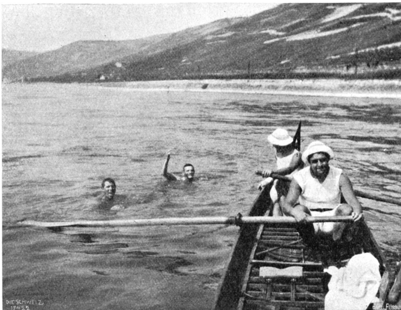
Basel-Rotterdam Abb. 4. Bad unterhalb dem Binger Loch.

Begleitet von einem Herrn vom Mainzer Ruderklub in einem Kanoe aus Aluminium verlieen wir Mainz um acht