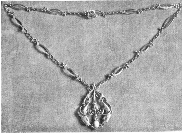
Anhänger in Silber mit Opal, entworfen und ausgeführt von Edgar Simpson, La Tour-de-Peilz.

modifizieren, sodas das fertige Stück ein Einheitliches bildet, dem keinerlei Zwang anhaftet. Der Anhänger mit den drei Bäumen, ein feines Vollrelief, ist um einen Smaragd, wie er