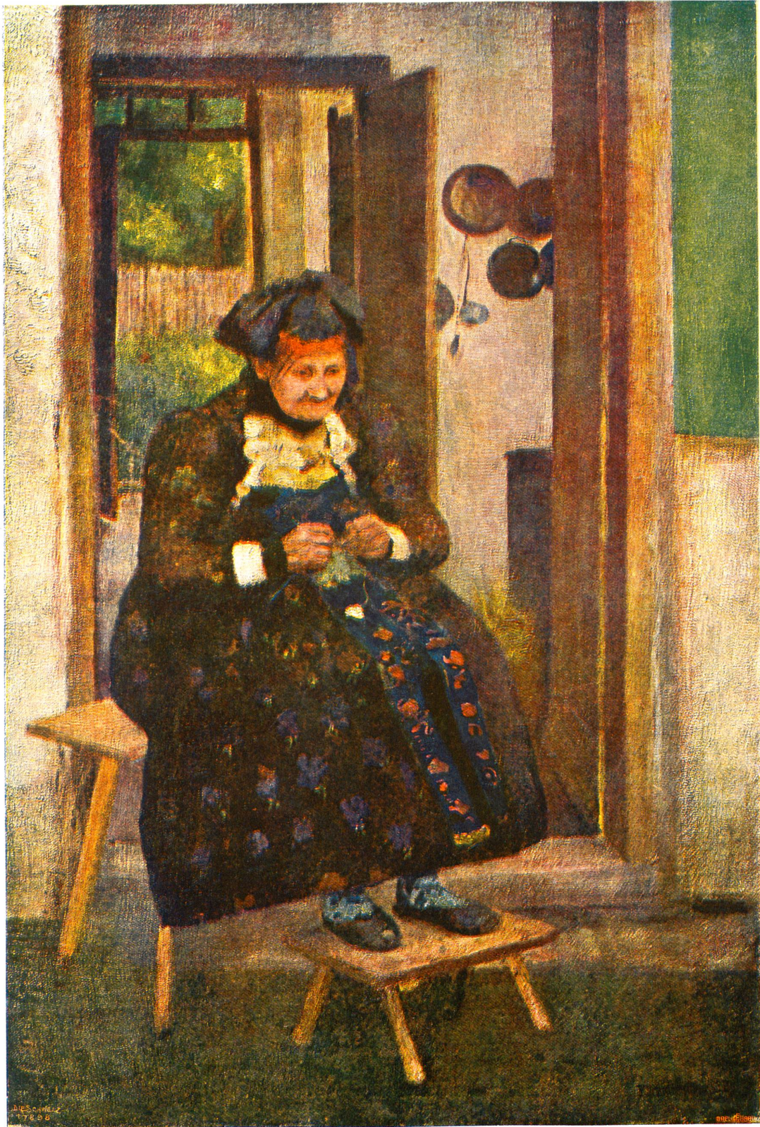
Emanuel Schaltegger (1857—1909).