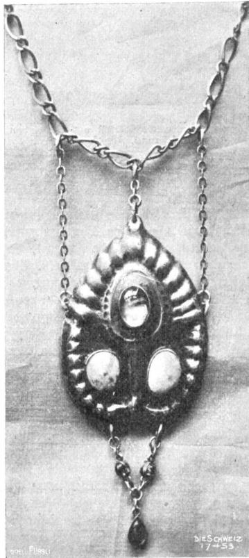
Anhänger mit Beryll, zwei Türkisen und drei Turmalinen, entworfen und ausgeführt von Hans Brühlmann, Amrisweil-Stuttgart, im Besitz von Frau Dr. Limburg, Adln.

der realistischen Novelle. Also wenigstens eine Seite der unheimlich reichen Kunst dieser Sondererscheinung unter den Dichtern ist vollgültig vertreten.