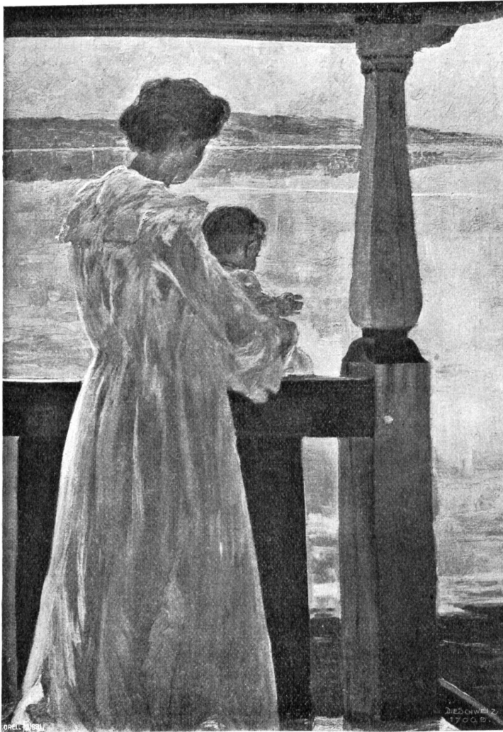
Hans Beat Wieland, Basel-München. Morgenjonne (1904).

„Du bist aber immer noch etwas zurück im ‚Jenisch‘!“ sagte dann der erfahrene „Kunde“, und nun erteilte er mir eine regelrechte Lektion im „Jenisch schmusen“, das heißt in der Stromersprache.