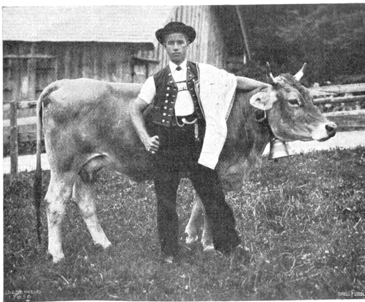
Coggenburger Senn (mit Sennenfittel, „Zwischschlütte“).