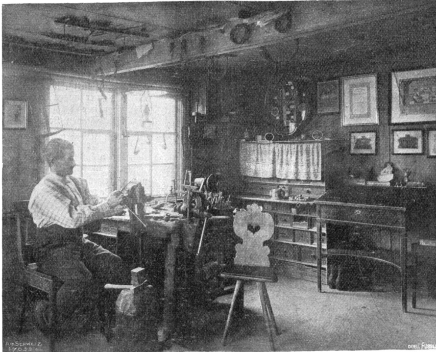
Toggenburger Sennentracht. Der „Schluchebue“ (im Bühl bei Neßlau) an der Arbeit.

Eine Stunde später erzählte man schon im Laden seines Vaters von dem Ueberfall. Der Eisprinz, ein junger Freiherr von der Ostsee, dessen Mutter auf der Reise erkrankt war, sodaß sie unverhofften Aufenthalt hatten nehmen müssen, war durch zwei Messerstiche in der Brust und einen Schlag gegen die Stirn schwer verwundet und lag hoffnungslos darnieder. Die Täter hatte man schon. Bläß und schweigend hörte Heinz Bräuer, was die Leute erzählten, und zog sich bald