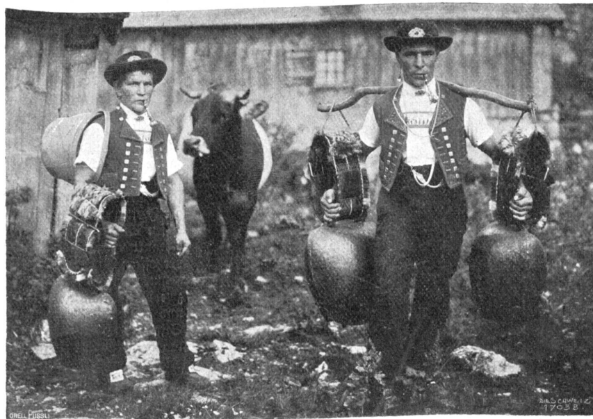
Coggenburger Sennen auf der Alp.

Nur einige Burschen befanden sich auch auf der Bahn, schwärzliche Gefellen aus einer nahen Fabrik, denen an diesem Samstag ein früher Feierabend gelungen war. Die trieben sich ohne Rücksicht in tobenden Wettläufen mit Geschrei und Gezerr und rohem Gliederschleudern durch die Menge