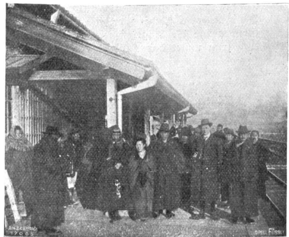
Abfahrt von Suwa.

So saßen wir lange und schauten auf das schimmernde Herz. Allmählich zog der Sonnenstrahl weiter, der Glanz wurde matter, immer matter, und endlich erlosch er.