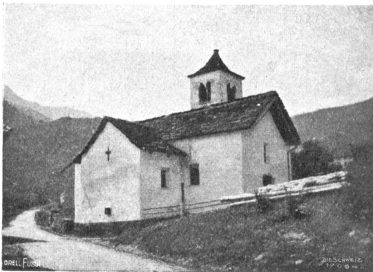
Columbanskirche von Scona, von E. A. gesehen.

Wir beschloßen, in Hausen, wo keine vermöglichen Leute wohnten, das Spiel zu kürzen. Nachdem Gexler den Apfel auf des Kindes Haupt als Ziel gegeben, sollte ich gleich um Erlassung des Schusses bitten. Es geschah so. Aber unser Gexler, der sein Sprüchlein wohl vor- und rückwärts konnte, fiel kläglich aus der Rolle. Grimmig stierte er mich an und sagte: „Du Chalb!“ Das war ein trauriges Fiasko. Gut, daß der eifrige Frießhard mit der Sammelbüchse schon um war. Enttäuschte Gesichter folgten uns, als wir, nachdem mich Gexler mit jener Verlegenheitsphrase auf das Stichwort hatte aufmerksam machen wollen, den Vorhang plötzlich fallen ließen, d. h. sofort abzogen. Einige größere Burschen, welche die Apfelschußzene aus dem Schulbuch kannten, forderten mit Kluchen ihr Geld wieder zurück und drohten uns mit Stecken.