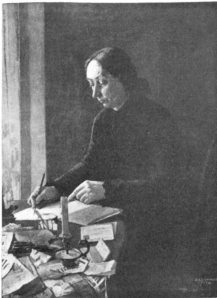
Bildnis der Schriftstellerin Louise Michel.

Der Verfasser unserer Broschüre beginnt damit, „die gegenwärtige Lage des Esperanto“ zu kennzeichnen. Bisher ist das Esperanto Zamenhofs Schöpfung und Verdienst. Er hat das Wunderbare geleistet, eine künstlich produzierte Sprache so weit zu entwickeln, daß sie viel ernster genommen wird als alle bisherigen Versuche in dieser Richtung, so ernst, daß der