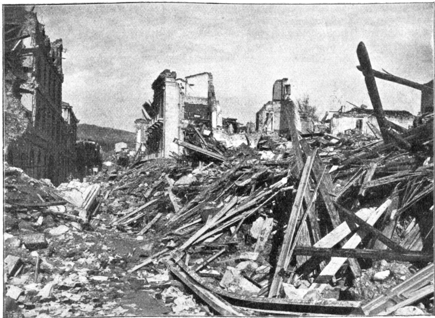
Von der Zerstörung Messinas. Via Capour.