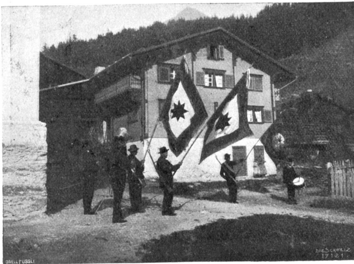
Knabenschaftsfahnen. Aufnahme aus Curaglia am Lufmanier.