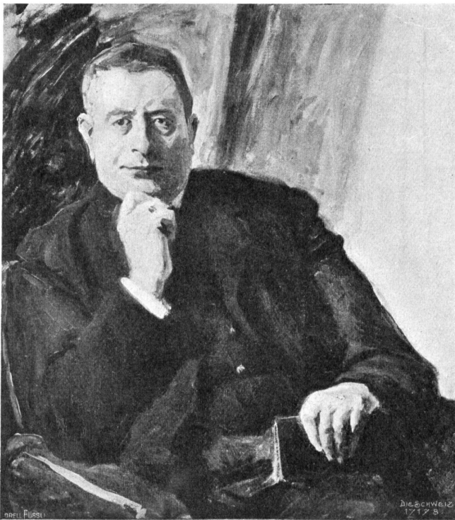
Fritz Burger, Basel-Berlin.

Bildnis des holländischen Dramatikers Hermann Heijermanns (1908).