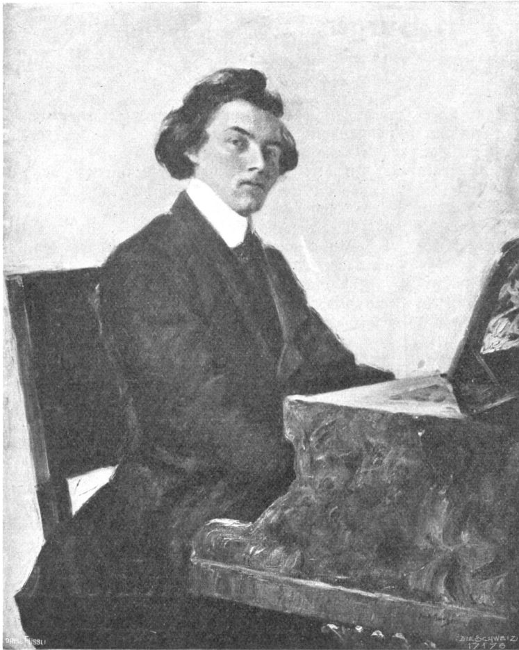
Fritz Burger, Basel-Berlin. Bildnis des schweizerischen Klaviervirtuosen Emil Frey (1908).

nearen, und einen Typ Veibl, der ganz im Malerischen liegt. Man kann ästhetisch überhaupt scheiden zwischen einem zeichnerischen und einem impressionistischen Porträt — ähnlich wie in der Landschaft, nur daß die Folgerungen größere sind. Beziehungsweise handelt es sich darum, daß, je zeichnerischer die Durchführung ist, um so mehr das psychologische Problem verstärkt wird, und je mehr die Farbe Selbstzweck wird, um so mehr es zurücktritt.