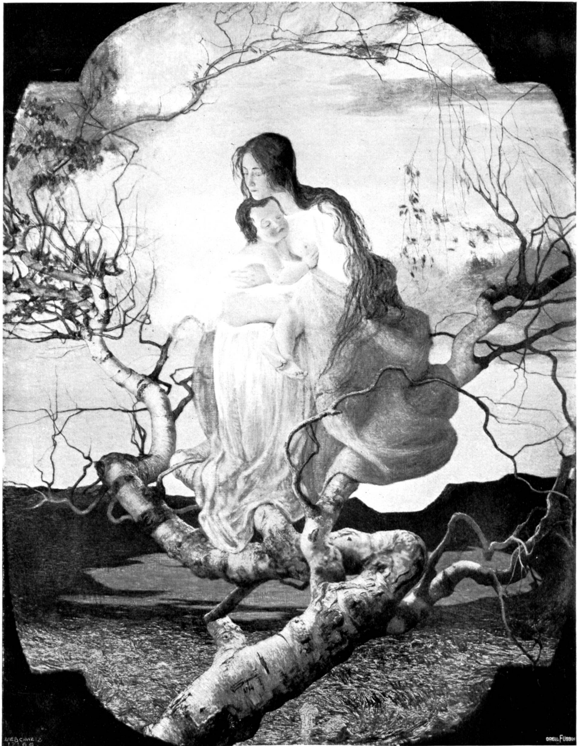
Giovanni Segantini (1858—1899).