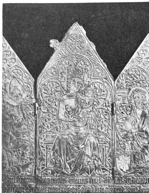
Madonna di Roccamelone. Kupfergetriebenes Altarrelief aus dem XIV. Jahrh. in der Kathedrale von Susa.

Zwischen den tannschwarzen Rücken leuchtet noch ein wenig das verblichene Abendgold herunter: es ist ja der Vorbote des freuderverheißenden Morgengoldes.