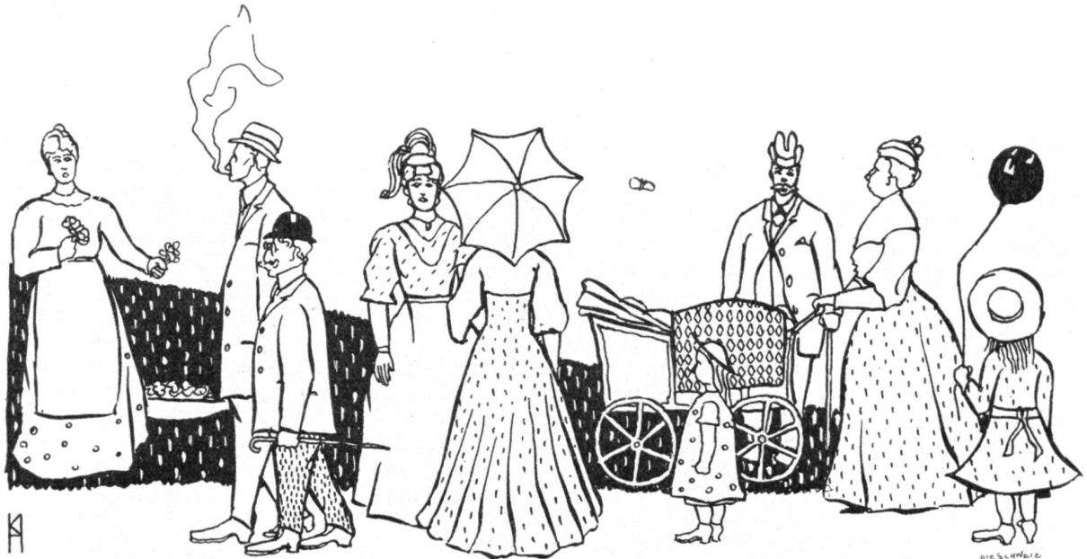
„Philister, die ihre Familie lüften.“