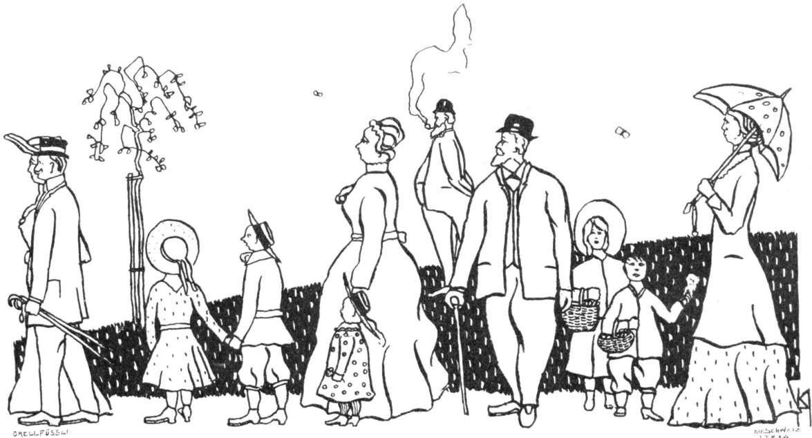
Karl Otto Hugin, Zürich.

wende sie sich an eine unsichtbare Macht, mit der sie in geheimen Kämpfen stehe, da sie nun weiter spricht: „So will ich denn zeigen, daß ich stark bin auch für ein Strahlchen Sonne, auch für ein Fleckchen ungewohnter Wärme und für eines Menschen kluges Angesicht!“