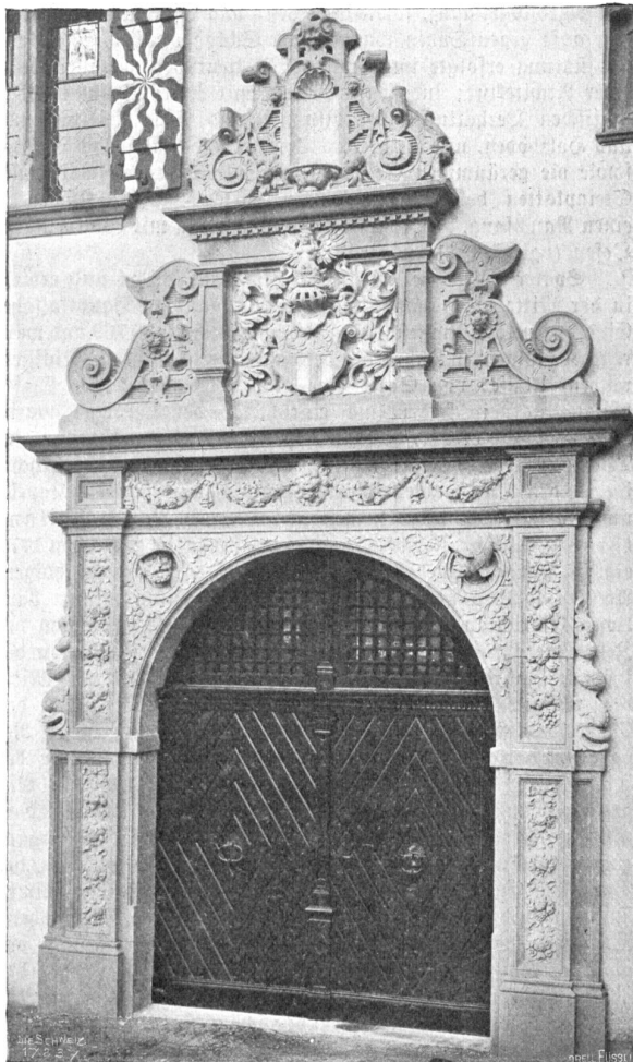
Schloß Marchlins. Hauptportal.

„Ich kann nicht, Herr Doktor, es ist zu grausam!“ „Lassen Sie doch diese Hyperästhesie einmal, Herr Pfarrer! Eine Wanderung in die Berge scheint mir mehr und mehr