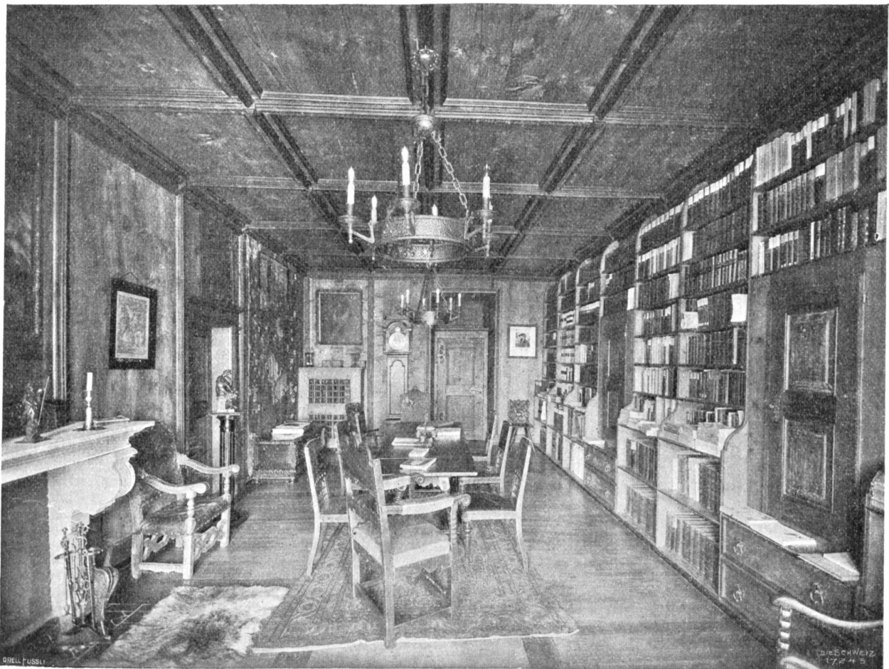
Schloß Marfchlins. Bibliothek.