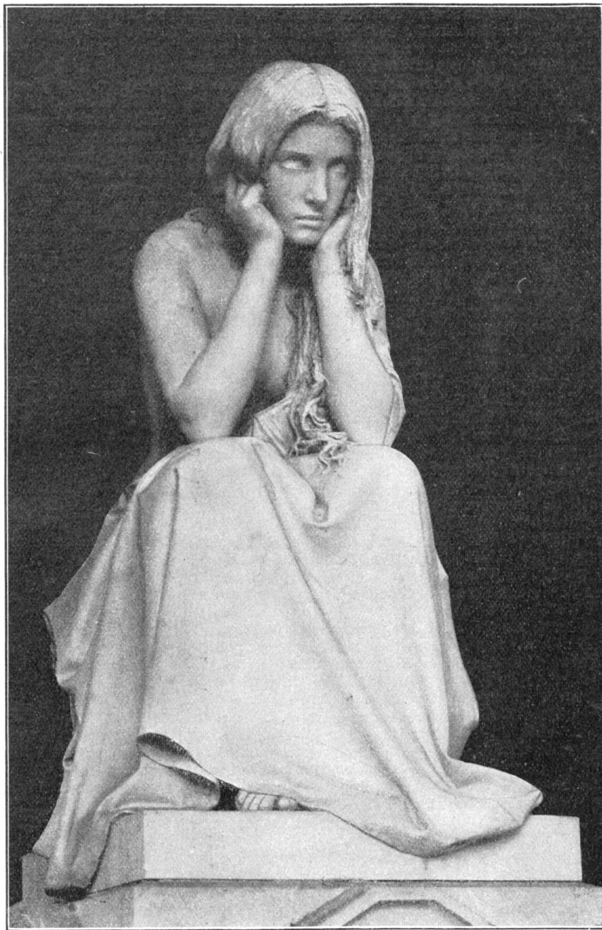
Vincenzo Vela (1820–1891). Die Verzweiflung (La Desolazione), im Gabrinipark (Villa Clani) zu Lugano.

ohne dem Museum in Ligornetto**) einen Besuch abzustatten: es gehört uns allen!