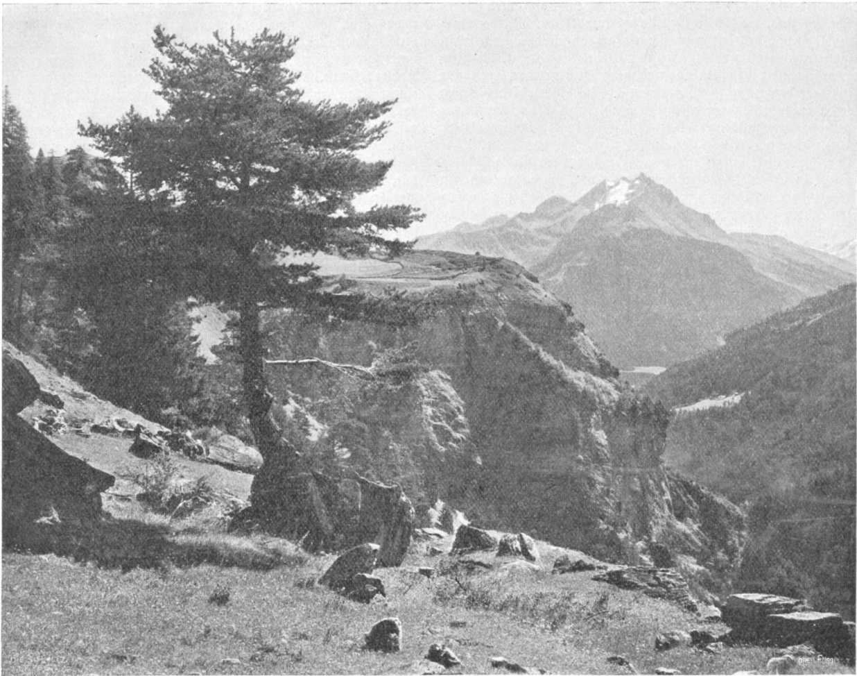
Alter Schyn. Bild auf Pic Mischel (3163 m).

Fraktion von Oberbaz, kommen, der Weg ab, der auf die Straße nach Solis oder nach Alvaschein-Tiefenkastel führt. Für die Rückkehr ins Domleschg empfiehlt sich die Besteigung des Mutterhornes und der Abstieg von da nach Zillis im Schamsertal, von wo aus man die Post durch die Biamala nach Thusis benutzen kann.