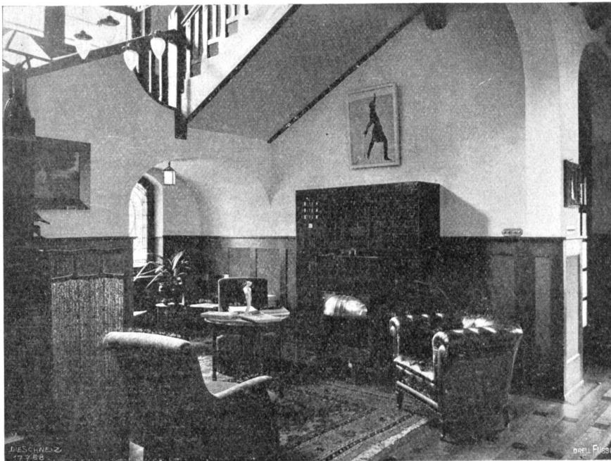
Architekt C. v. Murali, Zürich.

In fest gesammelten, klar durchgebildeten Formen stellt sich der äußere Bau dar, der sich im großen Ganzen an den Charakter Louis XVI hält. Auch die Farben sind vornehm und schlicht und der grünen Umgebung wohl angemessen: grau der massive Sandsteinsockel und die Fenstereinfassungen und hellgelblich die rauch-