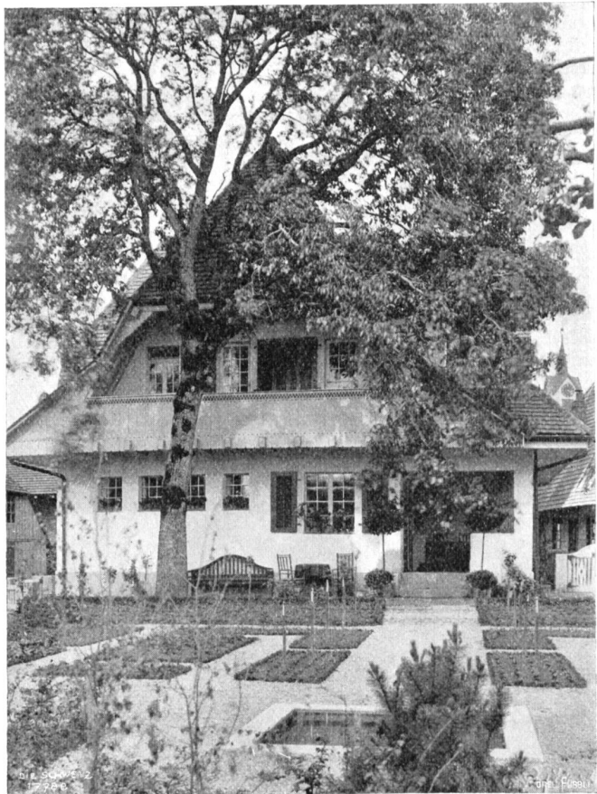
Architekt Otto Ingold, Bern. Das Haus Cuno Amiets auf der Dächwand, Südfront und Garten.

Sie neigte sich zum Wagenfenster hinaus und hielt die Hand des Studenten. Er fühlte, daß er ihr noch ein gutes, tröstendes Wort zum Abschied mitgeben müsse, drückte ihre Rechte warm und sagte: „Wollen Sie mir eine gute Freundin sein, Fräulein