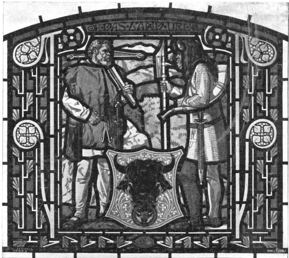
Mloys Balmer, Luzern-München.

Ein Prachtstück ist ferner die große Grisaille-scheibe aus der Peterskapelle in Luzern, die unsere Kunstbeilage wiedergibt. Eine Balmer'sche Stiftung, stellt sie neben dem Wappen der Familie die beiden Namensheiligen des durch die Stiftung Gebrühen dar, nämlich St. Moysius und St. Johannes den Täufer. Wie fein ist auch hier wieder der Gegensatz zwischen dem rauhen härtigen Wüstenprediger mit seinen nervigen Armen und dem einfachen Ueberwurf und dem jugendlichen Heiligen, der uns in tadelloser spanischer Kavallerstracht entgegentritt und dessen feines hartloses Gesicht auf ein bei den Jesuiten in Rom befindliches Originalporträt zurückgeht. Diese stark kontrastierende Zusammenstellung zweier so verschiedener Heiliger deutet auf die Idee von der allumfassenden Kirche.