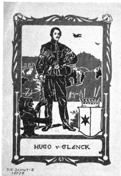
Mloys Valmer, Luzern-München. Exlibris.

Wir sind am Ende unserer Ausführungen angelangt. Wohl gäbe es noch manches Valmer'sche Werk, das verbiente, abgebildet und besprochen zu werden, so besonders auch die Fresken, von deren Bedeutung der wirkungsvolle Säbelzieher an der X. Nationalen Kunstausstellung in Zürich Zeugnis ablegte; allein der Raum gestattet uns nicht, auch darauf noch einzugehen. Immerhin hoffen wir, es sei uns gelungen, mit diesen Zeilen einen der begabtesten und vielseitigsten Schweizerkünstler zu würdigen und das Interesse für ihn und seine Werke bei seinen Landsleuten wachzurufen.