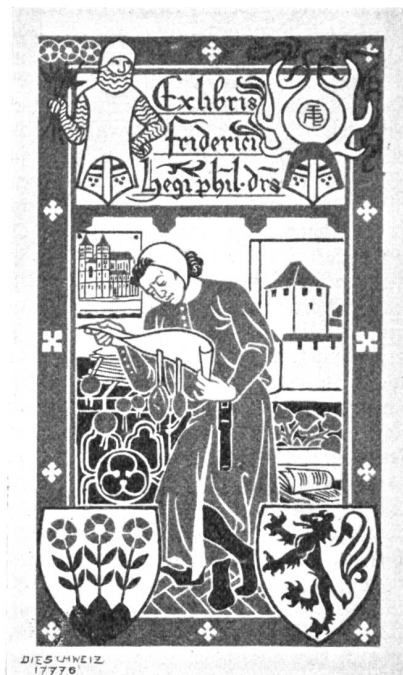
Mloys Valmer, Luzern-München. Exlibris.

wird, in manchen Fällen aber, namentlich bei neuern Wappen, vieles für sich hat.