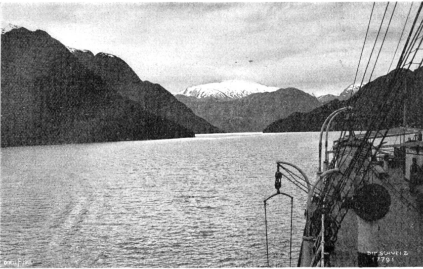
Smithkanal. Schneeberg im Hintergrund eines Engpasses.

formen, bis tief zum Meere hinunter von Firn bedeckt. Gar oft meint man, an einem nebligen Frühlingstag über den Vierwaldstättersee zu fahren, so häufig kehrt bei den bewaldeten Fluhbergen das „Bürgenstockmotiv“ wieder, so oft ragt ein „Urtrotstock“, ein „Bristenstock“ über die dunkeln Vorberge empor. Aber trotz allen Anklängen an heimische Formen durchdringt hier die Natur ein fremder, urweltlich schwerer Zug. Die Hügel sind stumpfer, massiver aufgebaut. Ihre Faltungen sind eigentümlich gewulstet und türmen sich in plumphen Staffeln übereinander auf. Auch die Schneegipfel zeigen ein anderes Gepräge. Scharf abgegrenzt liegen die weißen Flecke auf den kahlen Halden, und wo sich weite Schnee- und Firnfelder gebildet haben, sieht es aus, als ob der ganze Gebirgsstock bis nahe an den Gipfel im Wasser versunken sei und nur die obersten Partien noch eben heraussehnten. Vor allem aber fehlt dem Smithkanal der sonnige Liebreiz der schweizerischen Landschaft — wogegen der stärkste Kontrast zu den nordischen Bergen von Norwegen und Grönland hier in der üppigwuchernden Pflanzenwelt besteht, die mit ihrem Gürtel jede Anhöhe umschlingt.