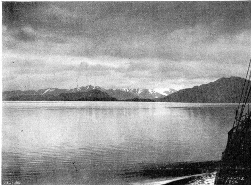
Smithkanal. Die „Cordillera del Sarmiento“ am Südbende des Kanals, spät bei hereinbrechender Dämmerung.

Während so die Pflanzenwelt trotz ihrer Artenarmut und