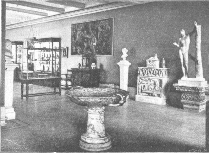
Galerie Fol im neuen Museum für Kunst und Geschichte in Genf.