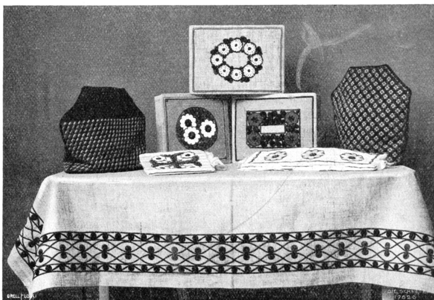
Walther Koch, Davos. Decke, Taschentuchkästchen, Kaffeewärmer etc.