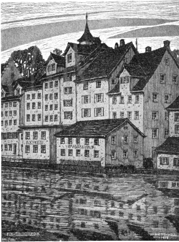
Die «Schiffe» in Zürich, darüber der «Lindenhof». Nach Zeichnung von Emil Bollmann, Zürich.

nicht aufgeräumt, die Geburtstagstafel prangte im Blumenschmuck, das schöne Geschirr glänzte im Licht. Da lag ein Brief an seinem Platz — die Schrift Kathleens — was war das?