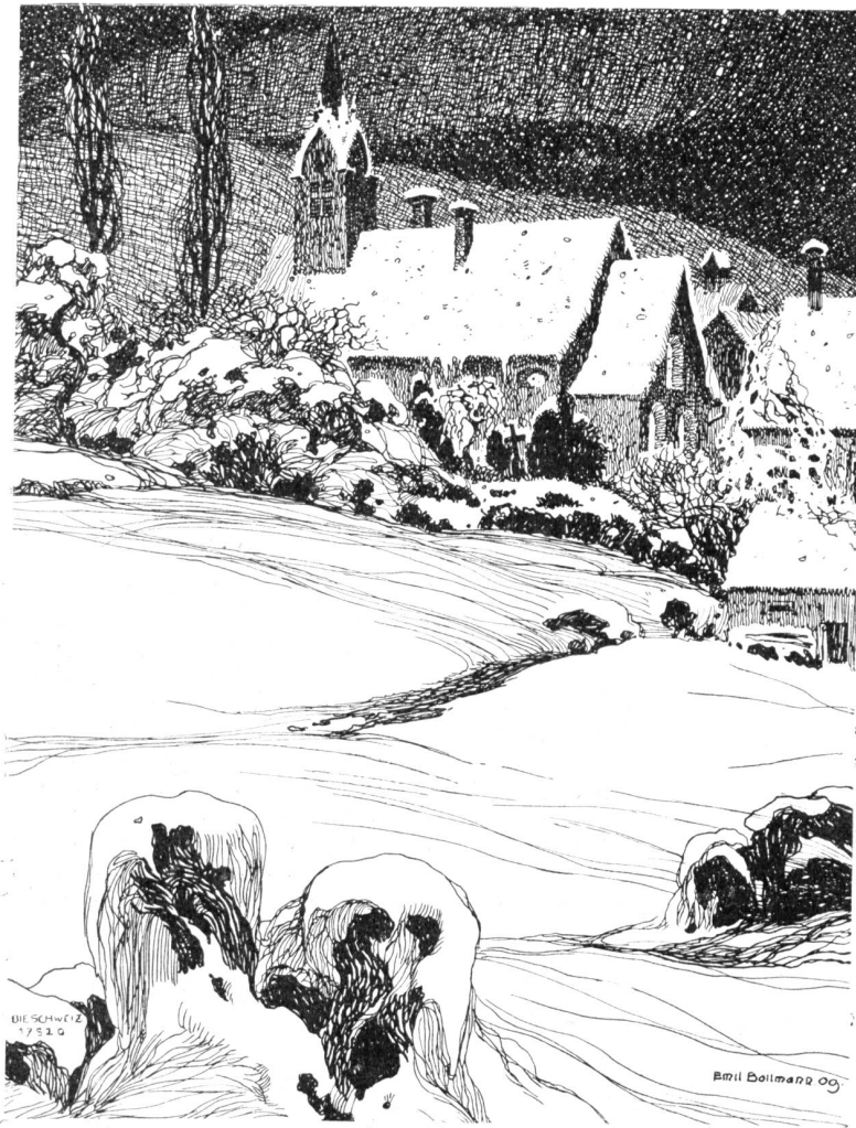
Alte Kirche von Wipkingen bei Zürich. Nach Federzeichnung von Emil Bollmann, Zürich.