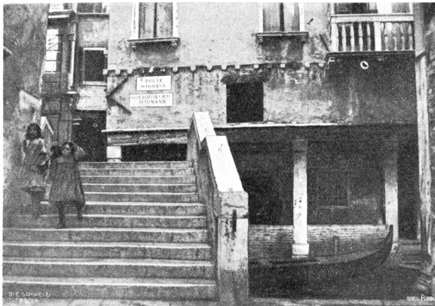
Die Widmannbrücke am Ende der Widmannstraße in Venedig.

Mit zwei Abbildungen nach photographischen Aufnahmen der Verfasserin.