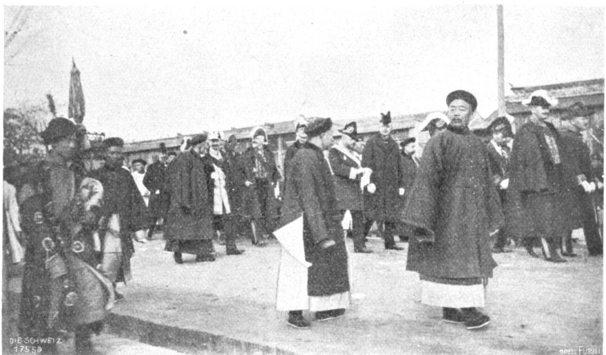
Hus China, Abb. 9. Das dem Katastroph vorangehende fremde Diplomatencorps, von hohen Mandarinen und Würdenträgern des Bei Wu Fu begleitet.