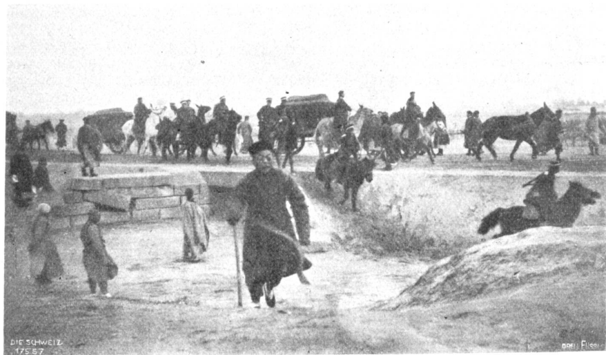
Hus China, Abb. 11. Das Gefolge der Kaiserin-Witwe auf dem neu angelegten Wege nach den Kaisergräbern von Tong Ling.

und außerordentlich wohlklingend. Leider hörte ich sie nur zum Schlusse der Saison in einem Concerte, sie sang eine Arie aus Rossini's Tell mit glänzender Wirkung. Auf dem Theater soll es ihr noch an Routine fehlen, da sie noch sehr jung ist, doch waren viele meiner Bekannten, die Urtheil in solchen Sachen haben und sie als Elsa im Lohengrin gesehen hatten, durchaus befriedigt von dieser Leistung.