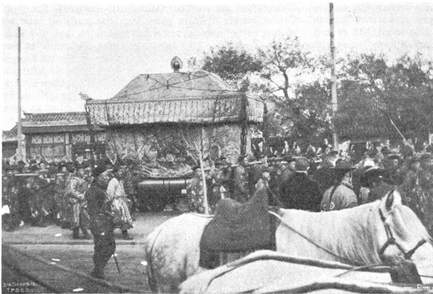
Hus China, Abb. 10. Katafalk, mit hellgelber, reichgestickter Seide behängt.

der griechischen Tragödie denke, und andererseits an die feine Charakteristik und das reiche dramatische Leben, das Mozart allen seinen Gestalten oft selbst in den unbedeutendsten Situationen einzuhauchen weiß, so habe ich die Empfindung, als ob die kostbarsten Bausteine damals in Deutschland zerstreut lagen, und das herrlichste Kunstgebäude hätte erstehen müssen, wenn man nur von einander gewußt hätte.