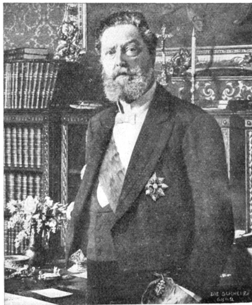
Dr. Karl Lueger †, Bürgermeister von Wien.

Jungfrauoch ist Mitte April ein bedeutamer Punkt erreicht worden; die Stollenbrust des Tunnels stand um diese Zeit genau senkrecht unter der Spitze des Mönch bei Kilometer 7,11, nur noch etwa 1900 Meter von der geplanten Station Jungfrauoch entfernt, die die Höhe von 3398 Meter aufweist. Die Bohrmaschine arbeitet jetzt 3270 Meter über Meer, also über der Gipfelhöhe des Titlis. Täglich werden 3 bis 4 Meter gebohrt, monatlich etwa 110 Meter. Wenn die Bohrungen in diesem Tempo weitergeführt werden können, dürfte zu Beginn des Jahres 1912 der Durchschlag beim Jungfrauoch erfolgen.