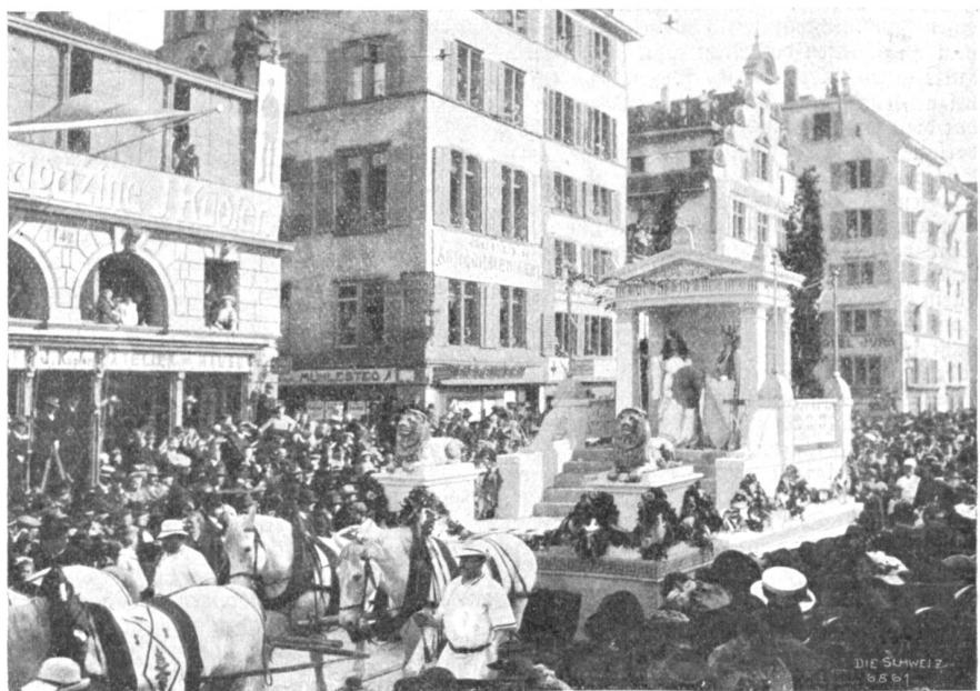
Schlußgruppe: Turica und Pallas Athene.

sie zu allgemeinem Wohl und Ergötzen beschließen, auch selber bezahlen. Wenn ein solcher Umzug angeordnet wird, dann figt