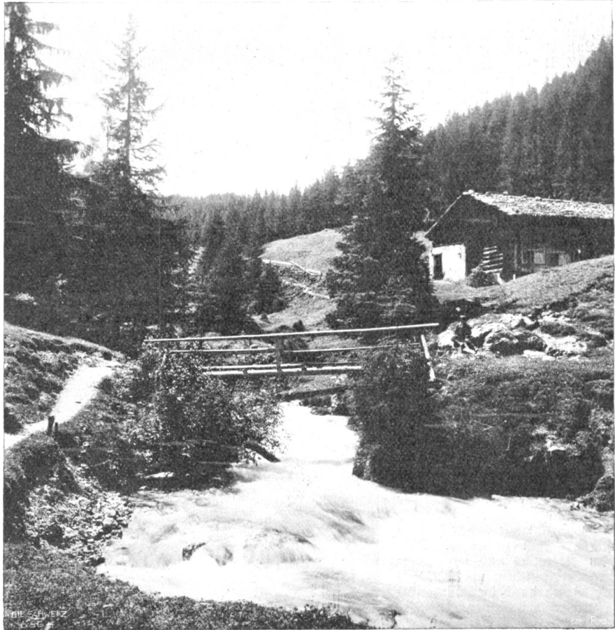
Motiv an der Landquart zwischen Klosters und Serneus.

Björnstjerne Björnson †. Aus Paris kommt die Nachricht, daß dort am 26. April im achtundsiebzigsten Altersjahr der nordische Dichter Björnstjerne Björnson nach langer, schwerer Krankheit gestorben ist, nach Zblen der bedeutendste Dichter