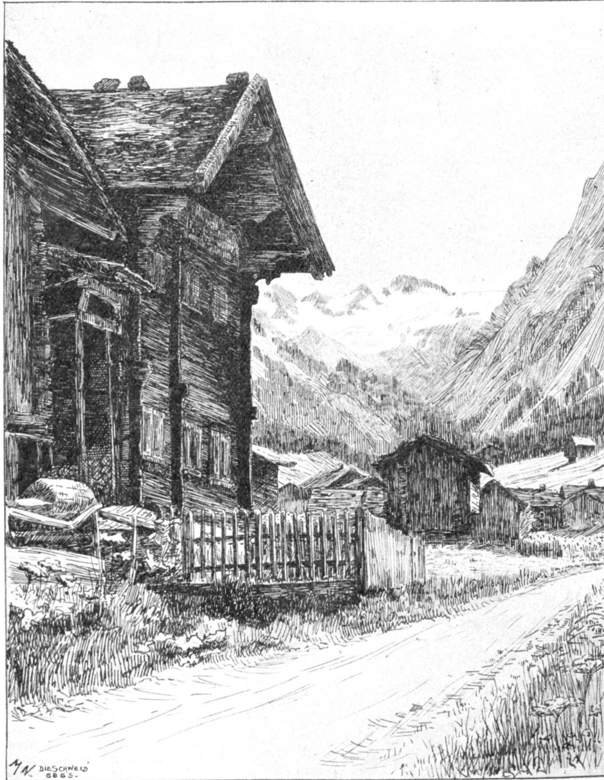
Altes Bündnerhaus an der Straße Klosters-Nowai. Nach einer Federzeichnung von Marguerite Naegeli, Zürich.

Das Klima von Klosters ist ein hochalpines. Die Luft ist jedoch mild, milder als bei 1250 Meter Höhe zu erwarten wäre. Die mittlere Jahrestemperatur beträgt 5,4^{\circ} , die mittlere Saisontemperatur 13,5^{\circ} C. Das Monatsmittel ist im Juni