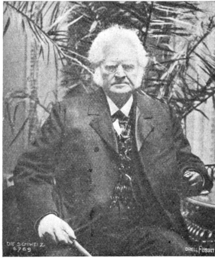
Björnstjerne Björnson †.

Die Arbeiten im Löttschbergtunnel schreiten rüstig vorwärts. Ende März dieses Jahres erreichte der Sohlstollen eine Länge von 9657 Meter, nahezu Zweidrittel der Gesamtlänge. Gegen 3000 Arbeiter sind an der Tunnelbaute beschäftigt. Die Tagesfortschritte auf der Südseite sind geringer als auf der Nordseite; auf dieser werden täglich 8,69, auf der erstern täglich 4,72 Meter ausgebohrt. Die Gesteinstemperatur vor Ort erreichte auf der Nordseite 15,6, auf der Südseite 32,4 Grad Celsius, die erschlossene Wassermenge auf der Nordseite 157, auf der Südseite 60 Sekundenliter. — Wie das „St. G. T.“ zu berichten weiß, wurden kürzlich bei Grabarbeiten in Arbon eine Anzahl römischer Gefäßscherben von verschiedenen zum Teil neuen in Formen gefunden. Sie befanden sich etwa 1 bis 1½ Meter Tiefe in Brand- und Modererde. Den interessantesten Fund bildete ein Mischstein von serpentinfarbigem Granit, der erste bisher auf diesem Platz gefundene, mit einem Durchmesser von 70 Zentimeter und einer Dicke von 8 Zentimeter. Die eine Seite ist glatt gearbeitet, die andere roh behauen und flach. — Im Vortrieb des Tunnels der Strecke Gismeer =