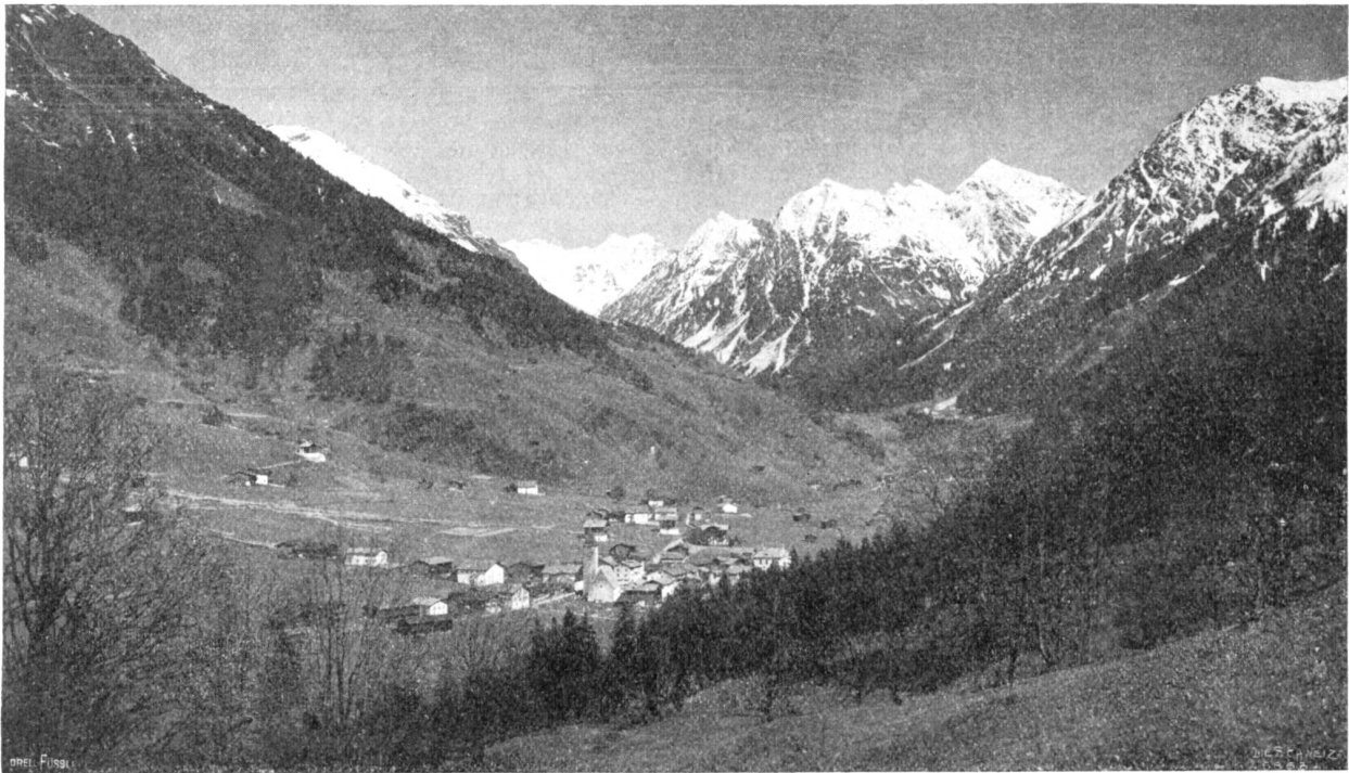
▲ Siloretta. ▲ Verfanklahorn. ▲ Weißhorn. Klosters im Prättigau mit der Silvretta im Hintergrund.