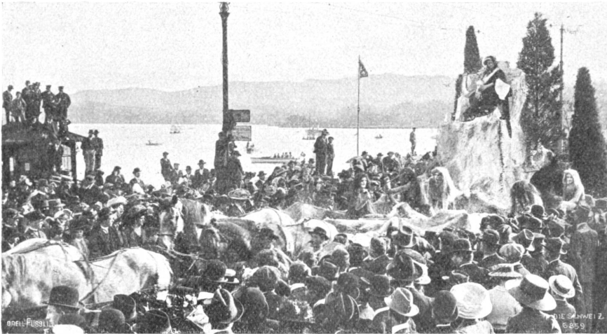
Zürcher Sechseläuten-Umzug: Der Böcklin-Wagen.