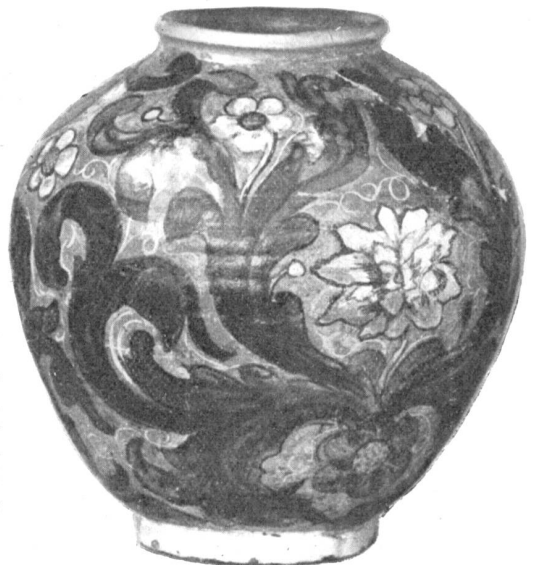
Keramische Sammlung Burkhard Rebers in Genf. Vier große Vasen für flüssige Drogen und Wasser. Italienische Töpferei des XVI. und XVII. Jahrh.'s.