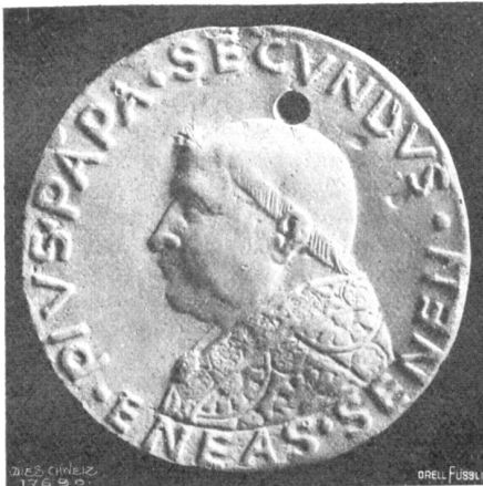
Bronzemedaille mit Bildnis von Papst Pius II., dem Gründer der Universität Basel (Abb. 1).

Nachdruck (ohne Quellenangabe) verboten.