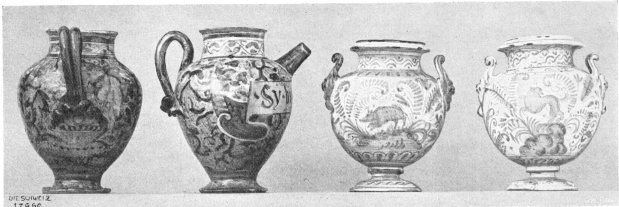
Keramische Sammlung Burkhard Rebers in Genf. Oben: Symbolisch-medizinische Gegenstände aus dem XVI. Jahrh. Unten: Reich ornamentiertes Apothekergefäß aus dem XVI. und XVII. Jahrh.