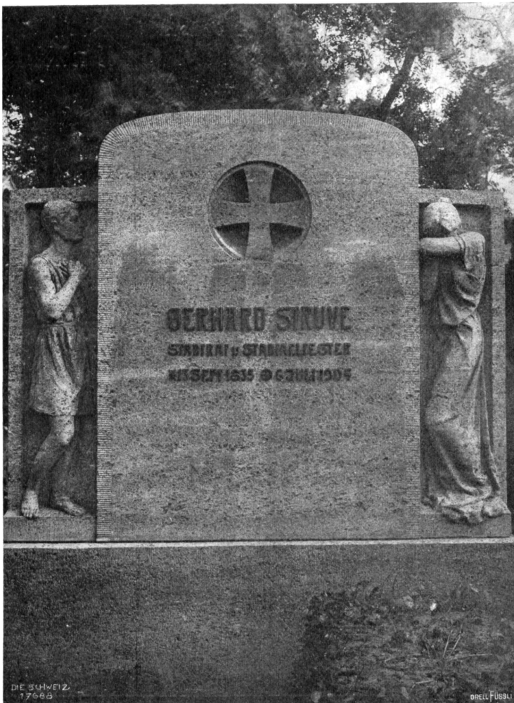
Grabdenkmal auf dem Matthäifriedhof in Berlin, von Regierungsbaumeister Heinrich Schmieden, Plastik von Jda Schaer-Kraule, Zug (1905), ausgeführt in Muschelfalkstein.

Die Hauptsache für die meisten Passagiere war natürlich das Markeneinkaufen. Es gibt in Tanger vier Postbüros, ein französisches, ein spanisches, ein deutsches und ein englisches; alle verkaufen ihre Landesmarken mit entsprechendem Aufdruck, und da diese Marken selten sind, bei dem unsichern Zustand der politischen Lage Marokkos gelegentlich Karitäten zu werden versprechen, so muß natürlich rasch ein Geschäft gemacht werden. Mehr als einer hat seinen ganzen Aufenthalt hier in den vier Poststellen verbracht und sonst keinen Blick in die Stadt getan. — Ich ließ mich zum Schluß noch von meinem Araber in den arabischen Bazar führen, wo ich aber meine Kaufgelüste gewaltsam unterdrücken mußte, da mein Geldbeutel nicht so an Fettleibigkeit leidet wie die Marokkanerinnen.