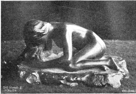
Ida Schaer-Kraule, Zug. „Eibechfen“ (Mädchen mit Eibechse spielend), Bronze, 1905.

neue schwarze Welt zu erhalten. Da galt der Besuch natürlich vor allem dem arabischen Stadtteil; das europäische Viertel bietet ja nichts Besonderes, und weiter hinaus konnte man nicht. Draußen vor der Stadt hatte man schon vom Schiff aus ein französisches Zeltlager beobachten können; denn der Kriegszustand, der in Marokko herrscht, machte sich wohl fühlbar in Tanger.